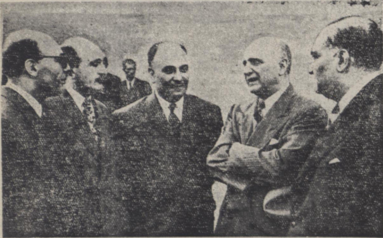
از راست چپ آقایان مهندس منظمی وزیر پست و تلگراف، هندرسن سفیر کبیر امریکا، دکتر غلامحسین مصدق، مهندس زنگنه مدیر عامل سازمان برنامه، دکتر فرمانفرمایان کفیل وزارت بهداشتی، چند لحظه قبل از عزیمت آقای هندرسن در فرودگاه مهرآباد

ولی آنانرا از کلیه مذاکراتی که با این دو مقام نموده ام آگاه خواهم ساخت