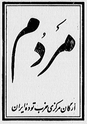
ارگان مرکزی حزب توده ایران دوره هفتم، سال اول، شماره ۱۵۱ شبهه ۶ بهمن ۱۳۵۸ - شماره ۱۵ روال