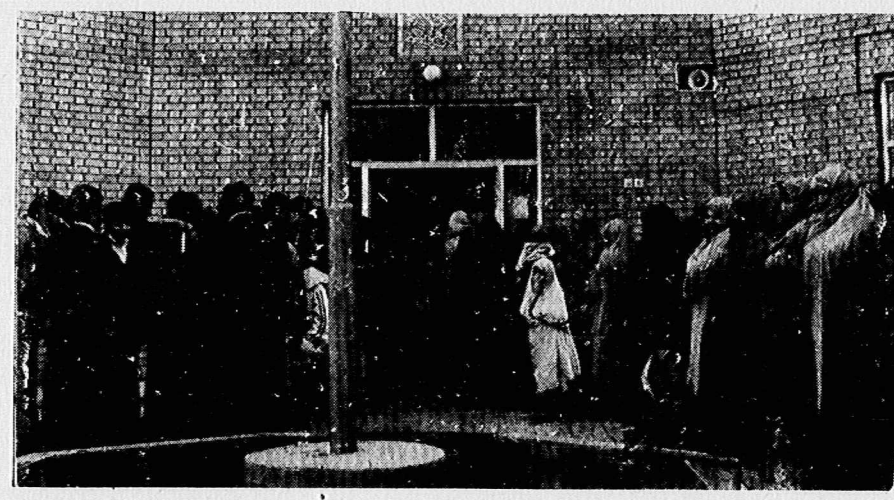
مردم از انتخابات بطور وسیع استقبال کردند

جنابلاط: اتحاد شوروی همیشه به حقوق ملی و مذهبی دیگر ملت‌ها احترام گذاشته و می‌گذارد جنابلاط، رهبر حزب مترقی سوسیالیست لبنان، غوغای افتراف آیین ضد شوروی را که بیلبان غربی در مورد افغانستان برآمده انداخته‌اند، محکوم ساخت. وی در گفتگو با خبرنگار رادیو مسکو در بیروت اظهار داشت: «این حزب یک دوش متین در مورد رویارویی افغانستان در پیش گرفته است. در این کشور توسط چنین نیروهای امپریالیستی صورت گرفت و به همین سبب اتحاد شوروی به افغانستان کمک نظامی کرده است.» جنابلاط گفت: «مالعرب فریب تبلیغات را نخواهیم خورد، اتحاد شوروی و حزب کمونیست آن همیشه به حقوق ملی و مذهبی دیگر ملت‌ها و همچنین به حقوق مردم افغانستان احترام گذاشته و می‌گذارد.»