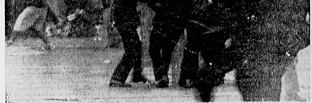
مارگارت تاچر در آستانه سقوط

لندن - انگلیس، ۱۹ اپریل - آسوشیئیشن پرس: ماورین پلیس سرکونکر لندن با با تون و سپرهای ضد شورش به مقابله با جوانانی پرداخته اند که در یک گروه ۴۰۰ نفری، محله «دیرکستون» لندن را برای چندین شب متوالی به فلاترین عرصه قیام نهائی اخیر انگلیس تبدیل کرده اند.