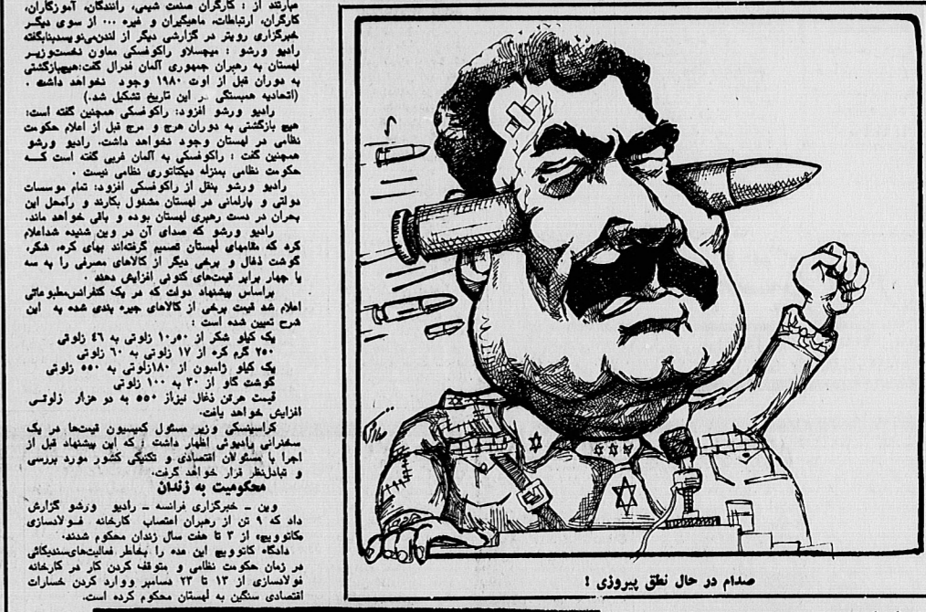
سفرها و دیدارها

در حالی که دولت لهستان به دو میلیون کارگر، قول باز نشستی قبل از موعد مقررداد داده است، در همین حال طرفی گسترده ای را برای بسیج میهنیان اردنی علیه لهستان آغاز کرده است. برای تکیه بر فراشه از دانشکده کارخان داران و آگاهی های ویدیو مشاور در امور اداری آمریکا در دست گرفته شد.