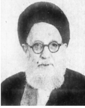
آیت الله العظمی شریعتمداری

موضوع انتقال از قم به تبریز مطرح نیست هنوز سیستم حکومت اسلامی پیاده نشده و مشکلات و نارسائی های فعلی مربوط به نظام اسلامی نیست یکی از اشکالات خودمختاری اینست که جنبه سرایتی دارد در صفحه ۲