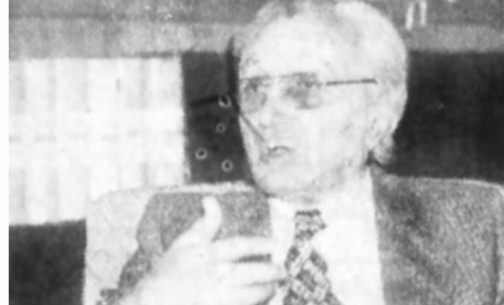
دکتر کریم سنجابی