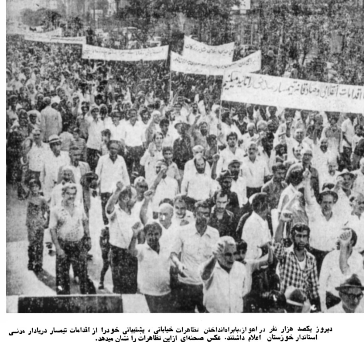
دیروز یکصد هزار نفر در اهواز، باران انداختن نظارات خیابانی، پشتیبانی خود را از اقدامات تیمسار درباردار مدنی استاندار خوزستان اعلام داشتند. عکس صحنای از این تظاهرات را نشان میدهد.