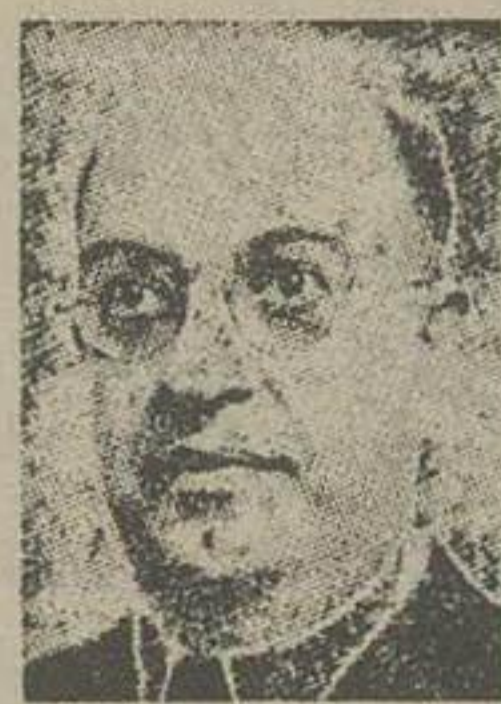
آقای مهدی نمازی سناتور