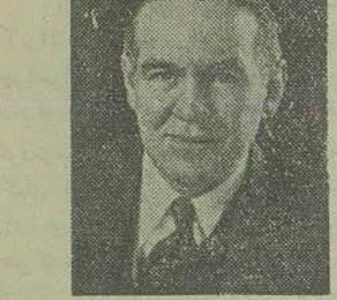
جان وریس رئیس میسیون اعزای کنگره آمریکا

جرج ال و اعضای کمیسیون روابط خارجه کنگره آمریکا در مدت توقف در تهران بحضور شاهنشاه شرفیاب شده با نخست وزیر و اولیای امور کشور ملاقات و مذاکره خواهند کرد. مستر «جرج ال» که چند روز پیش بسمت معاونت وزارت امور خارجه بقیه در صفحه دوازدهم