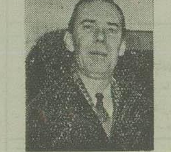
جرج ال معاون وزارت خارجه آمریکا