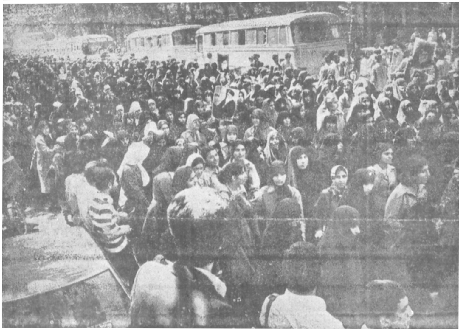
یک صحنه دیگر از تظاهراتی که بخاطر بازگشت آیت الله طالقانی دیروز در تهران انجام شد در صفحه ۲

۴۰ درصد تلفن وزارتخانهها مردم و انگار میشود امسال ۲۰۰ هزار متقاضی تلفن میگیرند ۸۰۰ هزار فیش تلفن در دست مردم است در صفحه ۷