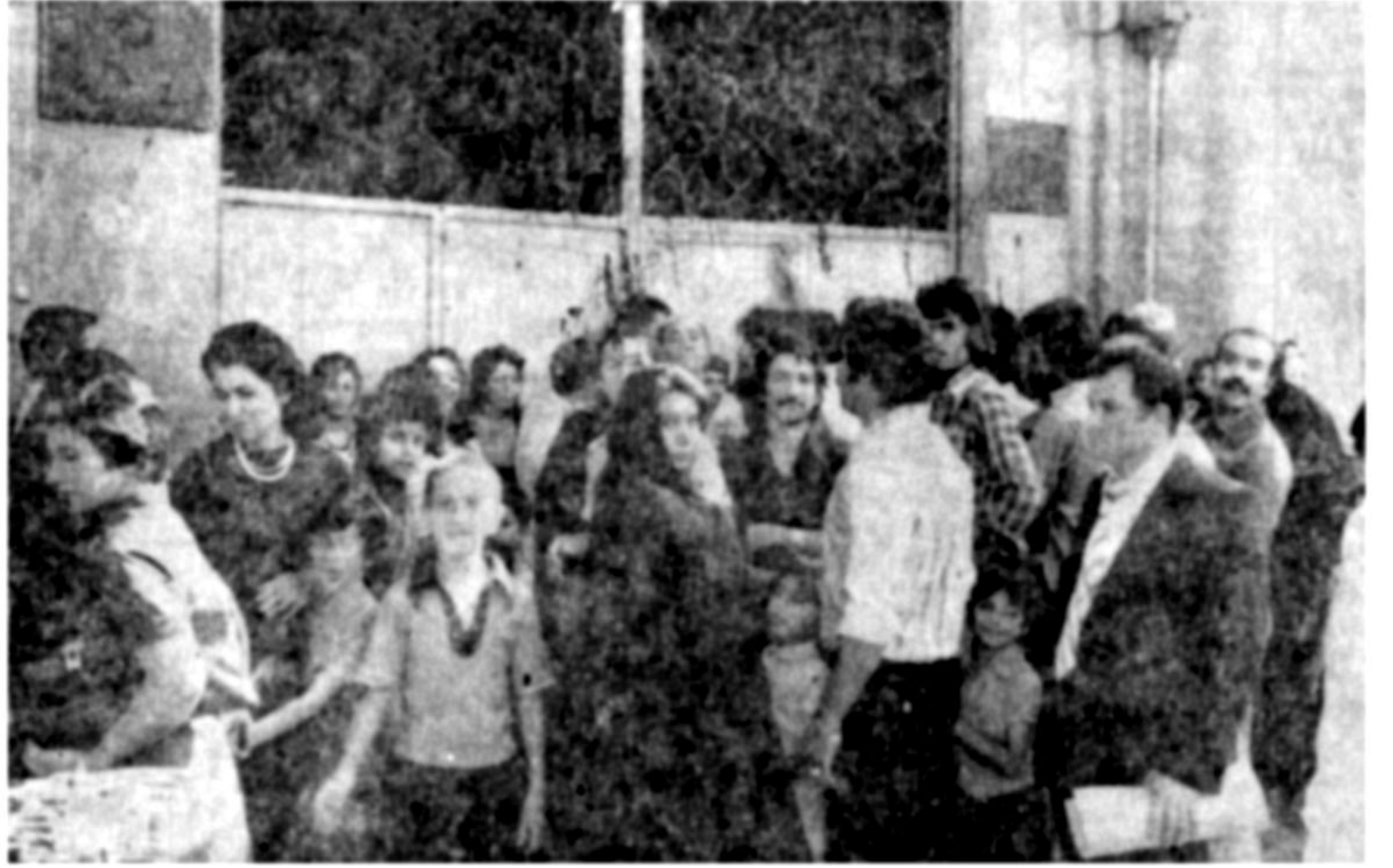
درهای مدارس خصوصی هنوز بهر روی دانش آموزان مشتاق ثبت نام بسته است! نویسی فرزندان خود روبرو هستند، زیرا مسئولان مدارس خصوصی حاضر نیستند زیر بار شهریّه های نقلی بیافه بروند.

مشکل کمبود جادر مدارس دولتی پدتر از مدارس خصوصی است. زیرا در اکثر مدرسه های دولتی بیش از ۷۰ تا ۸۰ نفر دانش آموز در یک کلاس درس می خوانند و روی هر نیمکت ۲ یا ۳ نفر بطور فشرده و ناراحت می بنشینند. بهمین علت در سالهای پیش بعضی از این مدارس به تدریس زسان خصوصی از دوره کودکتانی و ابتدائی نیست. یکی از مسئولین مدرس کیهان تو در مورد مختلط بودن یا نبودن این مدرسه گفت: تا این لحظه دقیقاً معلوم نیست که میتونیم کلاسهای مختلط تشکیل بدهیم یا نه، اما بنظر میرسد که وزارت آموزش و پرورش در مورد دورمرآهنگانی زیادستغیری کند و اجازه بدهد تا پایان این دوره دختر و پسر در کنار هم درس بخوانند، اما در حال حاضر ما منتظر هستیم تکلیف مختلط بودن مدرسه ها چه می شود تا براساس آن برنامه تحصیلی خود را تنظیم کنیم.