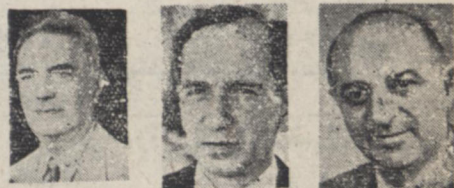
عضدی، نواب، مظفر اعلم

خود را با فرمان آقایان عضدی و واعلم و یواب اعلام داشتند. احکام مأموریت ده نفر از کارمندان وزارت خارجه صادر شد.