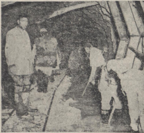
در این عکس دهانه تونل کوهرنگ و مسیر سرایشی که آب را پایین و مغرب زاینده رود برای آبیاری هزاران ریب زمین میفرستد مشاهده میکنید