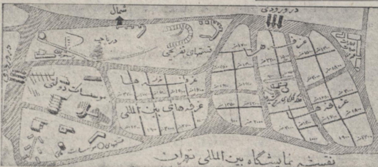
نقشه نمایشگاه بین المللی تهران

در این نقشه قسمتهای مختلف نمایشگاه بین المللی تهران بطور تفکیک نشان داده شد، و محل غرفه ها، قسمتهای تأسیسات دولتی و ملی و محلهای بین المللی نمایشگاه نیز مشخص گردیده است همچنین مساحت غرفه ها و جایگاه مخصوص فریب و مهیا بخانه و دریاچه معلوم میباشد