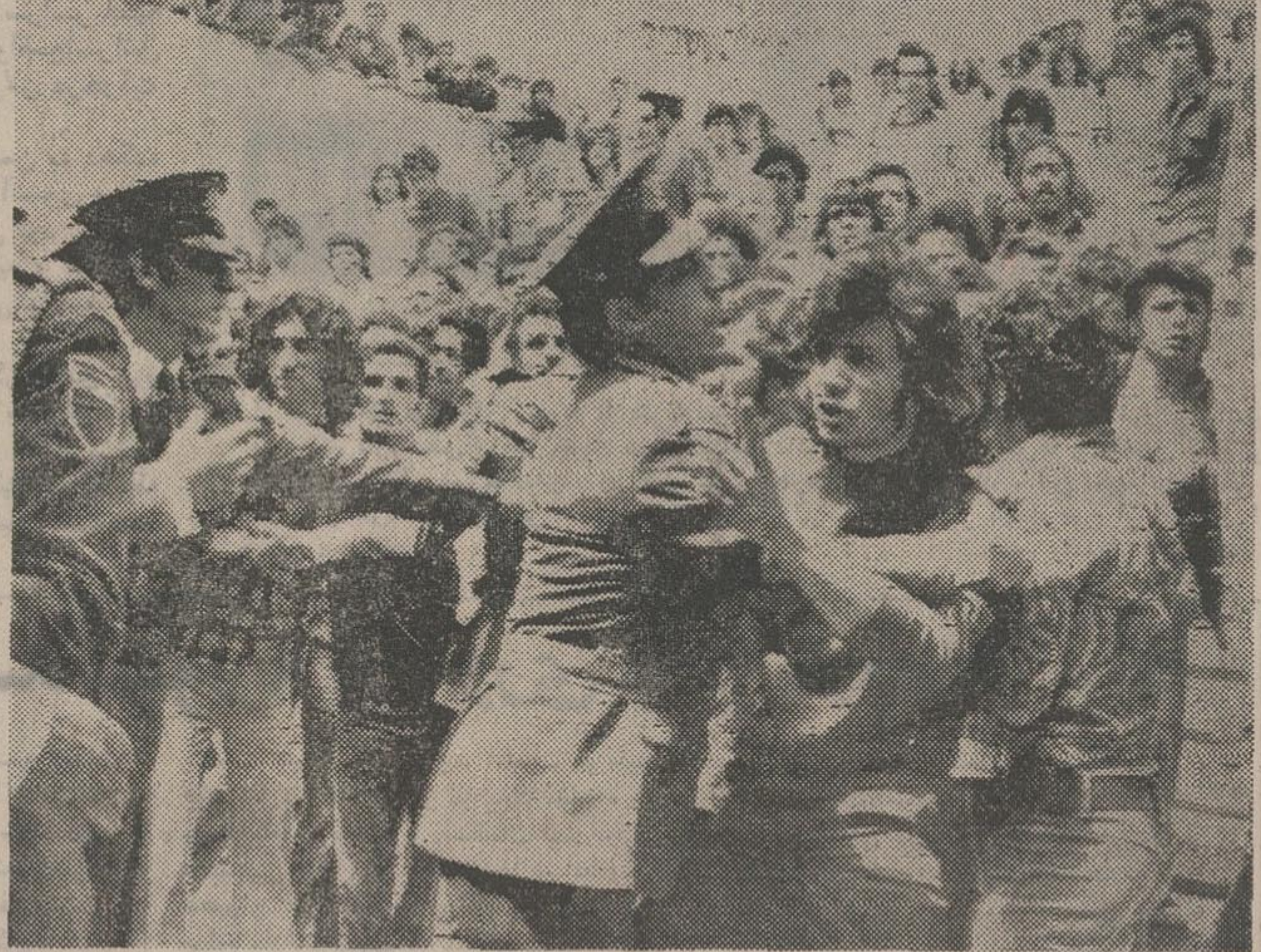
دیروز گروهی از مردم شهر کربلا شومنه که اخیرا مورد حمله چریکهای عرب قرار گرفت ساختمان پارلمان اسرائیل را مورد حمله قرار دادند و با پلیس به زد و خورد پرداختند. آنها فریاد میزدند دولت نمی تواند امنیت ما را تامین کند. عکس یک صحنه از زور آزمایی مردم و پلیس را در برابر ساختمان پارلمان نشان میدهد.

دولت عراق تا ۸ روز دیگر تمام کارمندان غایب کرد را برکنار میکند. در صفحه ۴