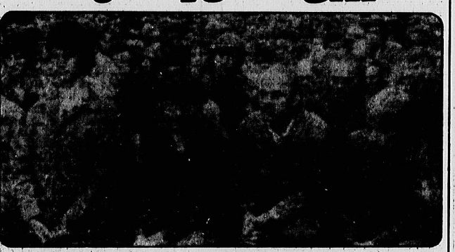
بحران سیاسی - ایدئولوژیک کارگری در لهستان تنها مشکل این کشور نیست، بلکه وامها و بدهکاری‌های کلان نیز از شیرین‌کاری‌هایی است که جهان آن گرن پایه هم‌پاشی شوروی را گرفته است.

لهستان کشوری از بلوک شرق که اقتصادش در زمینه راهی ایدئولوژی مارکسیسم لنینیسم مبتنی است، اکنون در دست کمک بیرونی و سرمایه دانه دراز کرده است. کشور لهستان در پی درخواست اعتبار ۱/۲ میلیارد دلار قرض، اکنون آمریکا را در مواجهه با درخواست وام سه میلیارد دلاری لهستان بر سر دوزخی قرار گرفته است.