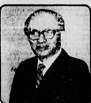
مناخس کینگ و دیبک پوتاه نخست‌وزیران رژیم فاشیست و نژادپرست اسرائیل و آفریقای جنوبی، تروست‌هایی که خود را به سلاح هسته‌ای نیز مجهز می‌سازند.