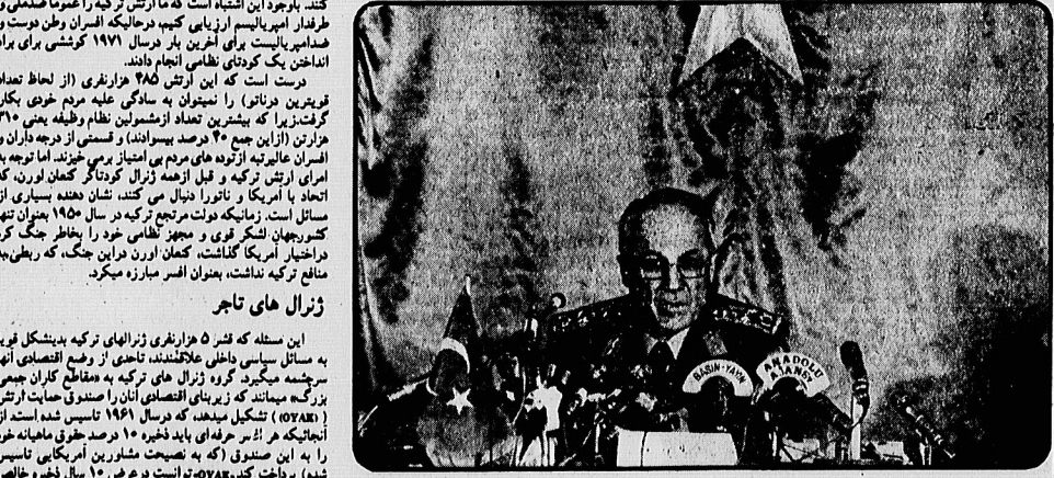
ژنرال و کمان‌آورده رئیس شورای امنیت ملی و افسری که رهبری کودتای فوازمه سپتامبر ۱۹۸۰ ترکیه را در دست داشت.

مدیران عظیم‌ترین بنیادهای ترکیه که جمع بیلان آن در سال ۷۸ بالغ بر ۴ میلیارد لیره ترکی بود، فرماندهان قوای سه‌گانه ارتش یعنی ژنرال‌های کودتاگر ۱۲ سپتامبر هستند!