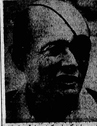
حسین فیروز کرده است که قسمتی از اسرائیل ملحق شود...