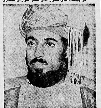
فایوس سلطان عمان در مورد خطراتی که منطقه خلیج فارس می کند فریبناخته در مطرح می سازد که دقیقا همانهایی هستند که در واشنگتن و محافل وابسته به پنتاگون رایج می باشد.

سرویس های اطلاعاتی دولت های عضو شورای همکاری خلیج (فارس) اخبار و اطلاعات خود را صریح و مفق بیان میدارند ؛ به پند توریستی، که در نظر داشت در ۱۶ بهمن سال گذشته، کودنای، در بحرن بره انداز مشکل از شصت تن بود که شش سلسل سنگین، موازنه مطابقت و مقادیری نارنجک را اختیار یافته اند.