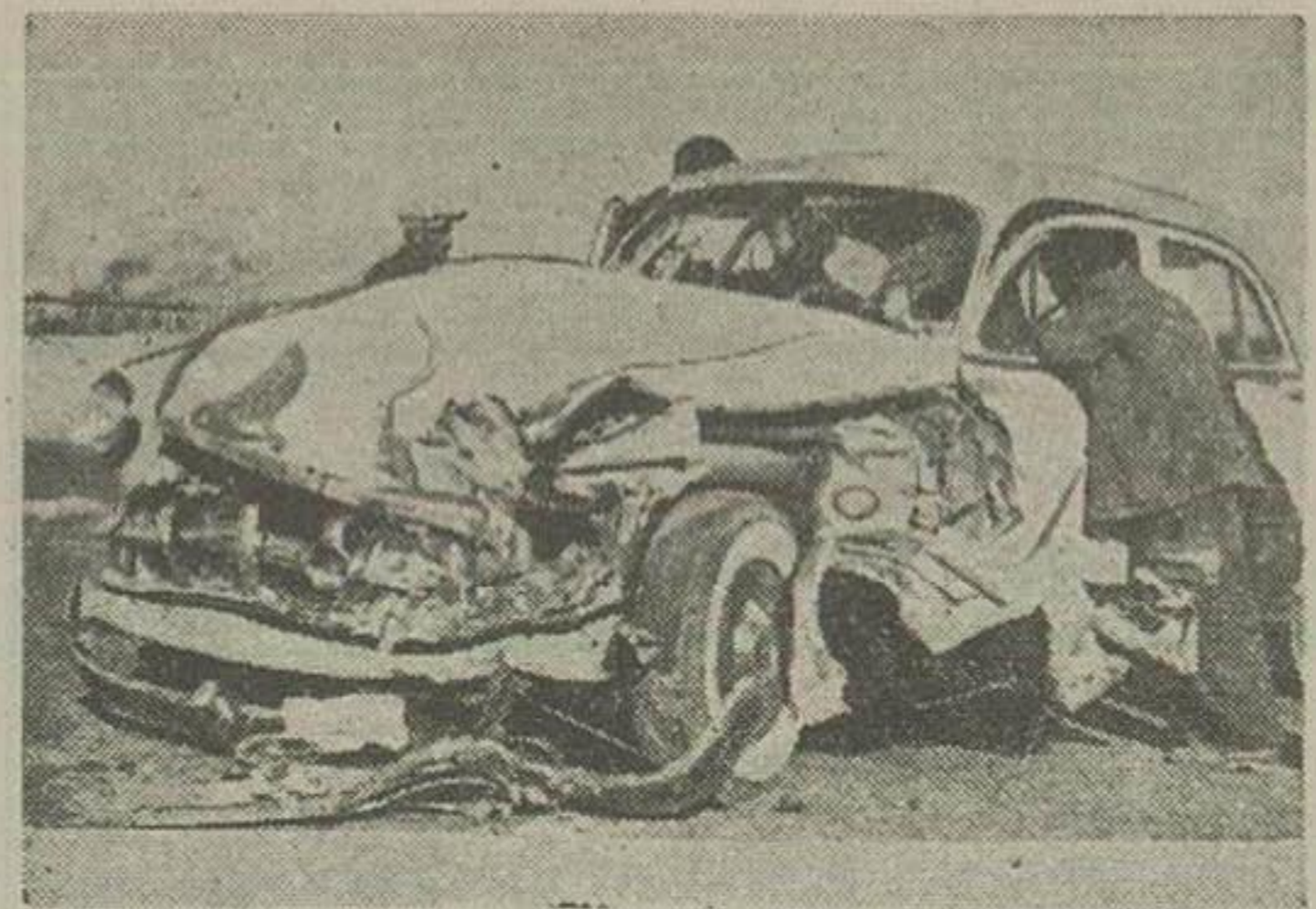
در عکس بالا اتومبیلی که در جاده کرج بر اثر تصادف با کامیون متلاشی شده دیده میشود

که در حادثه قتل رسیده است اتومبیل سواری ماشینی که بانبره سه رنگ دولتی بسرعت دل جاده را میشکافت و از کرج بسوی تهران پیش میرفت دو ساعت از شب گذشته اطراف کاروانسرا سنگی در تار یکی هیتی فرو رفته بود و فقط تیر و قوی چراغهای اتومبیل تا بیست قدمی طول جاده را مشخص میکرد عده سر نشینان اتومبیل عبادت بود از هشت نفر مرد و زنی که پشتدل نشسته و دانشکی اتومبیل را برعهده داشت جاده ظاهراً خلوت و آرام بود بقیه در صفحه دوازدهم