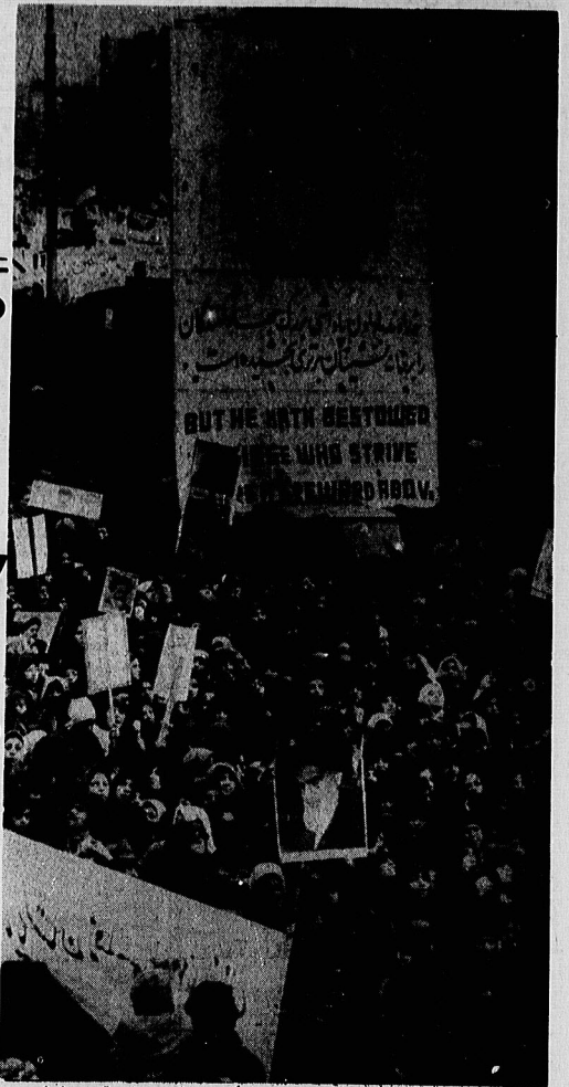
سپهر و شام جمعیت بسا تصویر امام خمینی مطهر بزرگترین مجاززه سیاسی قرن در ایران

ایران به هیچیک از بلوک های نظامی نخواهد پیوست