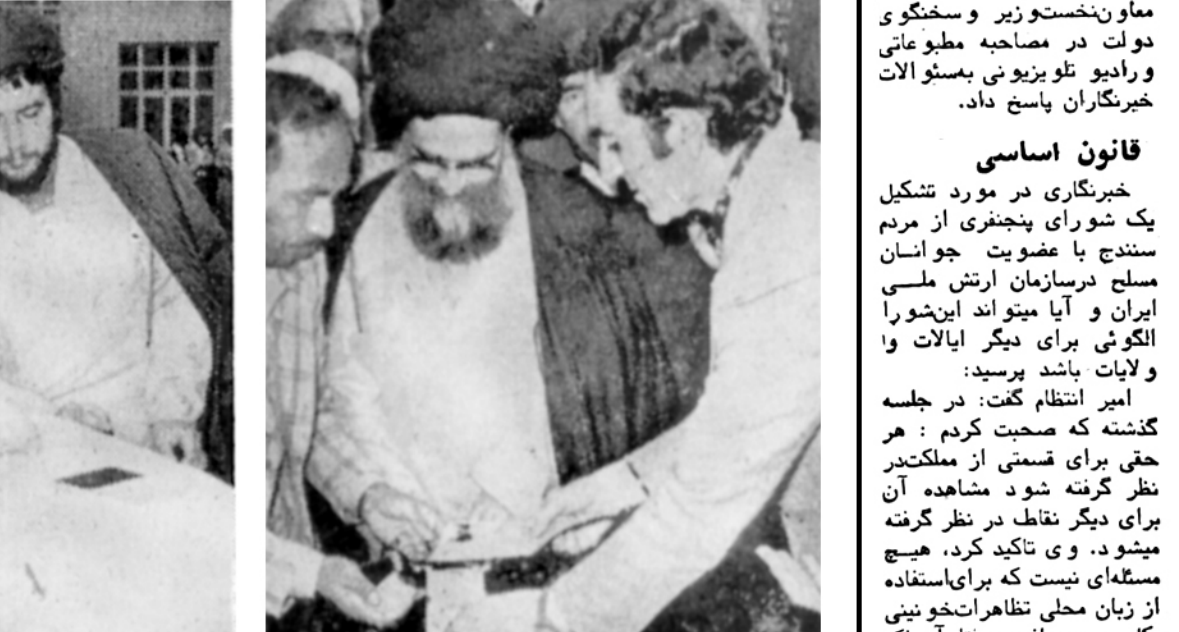
حضرت آیت الله محمد صادق روحانی و حضرت آیت الله محمد وحیدی آراء خود را در تأیید جمهوری اسلامی به صندوق میزنند.

احمد صدر حاج سیدجوادی و ارقام صحیح و قطعی برای این رفت و آمد که از ساعت ۱۰ شب به بعد پس از اتمام اخذ رای شروع شده بود تا کمی بعد از نیمه شب ادامه داشت. در آخرین دقیق بایان وقت تعیین شده برای اخذ آراء، افرادی که تا آن موقع موفق شده بودند به دادن رای خود در صندوق انداختند. کلیه پاسداران انقلاب پیش از آنکه به این اقدامات بپردازند این امامت را به ملت سپردند و انتقال صندوق های ملو از رایز کمیته ها و مراکز ۱۴ خیرنگار ما اظهار داشت که به دلیل شتابزدگی و بیجهان مردم عادی، در حوزه های رای گیری از درجام دیده می- شد، امروز (دیروز) در این حوزه ها آراء رای گیری برقرار بود و مردم بتدریج به حوزه ها مراجعه می کردند و رای میدادند، البته در بعضی از نقاط کشور بدلیل اختلال عناصر