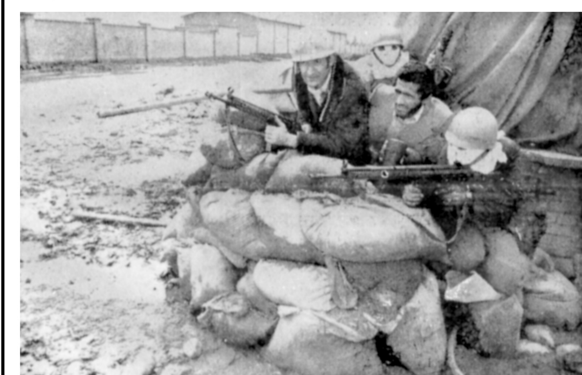
یکی از سترگ هائی که پاسداران انقلاب اسلامی در گنبد برپا کرده اند. عکس از بیتی لطفعلی نژاد خبرنگار تونس مقر موقت (مصر و اسرائیل) محکوم