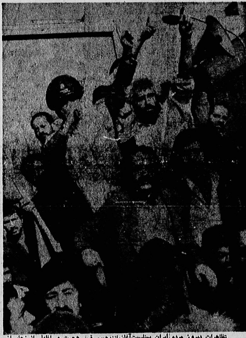
تظاهرات دیروز مردم ایران بنسبت آغاز بزدن فرین هجرت و اظهار اسزجار از امیرالمؤمنین امریکا ، در عین حال جلوگیری بود از اراده مردم برای مبارزه . و شهادت براین عکس ، یک سرگرد ارتشی که کتوشیده تا آمالگی شهادت را برای مقابله با داخله نظامی امریکا ابراز کند ، دیده می شود

حزب دموکرات دوباره به رسمیت شناخته میشود شرط به رسمیت شناختن مجدد این حزب این است که مخالفتی نداشته باشد تردها روی کلمه خود - مختاری اصرازی ندارند قصد نداریم سفارت ایران در امریکا را تعطیل کنیم در صفحه ۱۰