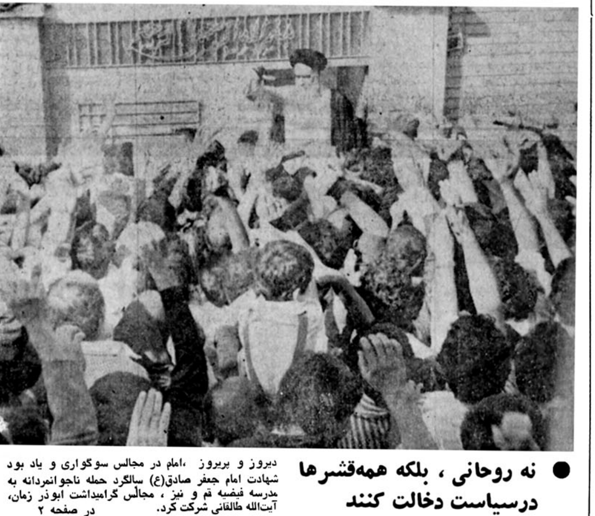
دیروز و بیروز، امام در مجالس سوگواری و یاد بود شهادت امام جعفر صادق (ع) سالگرد حمله تاجراندرانه به مدرسه قیضه تم و نیز، مجالس گرامی داشت ابوذر زمان، آیت الله طالقانی شرکت کرد.

طبق لایحه‌ای که به تصویب هیات دولت رسید اراضی تصرف شده دهقانان گران و گنبد پس داده خواهد شد اراضی مصادره شده خاندان پهلوی در گران و گنبد به دهقانان فاقد زمین واگذار خواهد شد کمیسیونهای ۵ نفری مامور رسیدگی شکایات مردم گران و گنبد خواهند شد در صفحه ۱۰