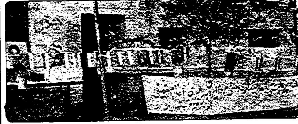
به منظور بزرگداشت دومین سالگرد پیروزی انقلاب مردم ایران، از سوی هواداران حزب توده ایران در گومسار نمایشگاه عکس و پوستر و بمدت سه روز از ۲۱ بهمن ماه در این شهر برپا شد. این نمایشگاه که دربرگیرنده عکس‌هایی پیرامون پیروزی انقلاب از آغاز تا ۲۲ بهمن ۵۷ بود، در مدت برپایی مورد استقبال مردم گومسار قرار گرفت.