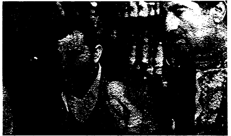
یک کارگر بیکار: می گویند گوشت کیلویی ۴۰ تومان و پرتقال کیلویی ۱۵ تومان را چگونه بخریم؟

پتیه از صفحه ۱ ۶۰ ریال بود، در اسفندماه امسال به کیلویی ۲۴۰ و سیال رسیدیم است. یعنی ۳۰۰ درصد گرانتر از سال گذشته و ۲۰۰ درصد گرانتر از چندماه گذشته شده است! قیمت میوه هم نسبت به سال گذشته تا ۱۱۴ درصد تری کرده است. خبرنگاران نامه «مردم» که در تقابل مختلف شهریان زحمتکشان گفتگو کرده اند، می نویسند: «افزایش قیمت ها توسط سرمایه داران بزرگ، زندگی مردم، بویژه زحمتکشان را مختل کرده است. در حالی که بر دستمزد کارگران و حقوق کارمندان افزوده نشده است، قیمت اجناس روز بروز افزایش می یابد. زحمتکشان آشکارا می گویند که قدر به خرید کالاها ضروری روزانه خود هم نیستند، و این درحالیست که قیمت ها هر روز از روز پیش گرانتر می شود» گشتی در بازار خرید روزانه نشان میدهد که گوشت، که یکی از مواد غذایی پر مصرف مردم است، در عرض یکسال ۱۰۰ درصد گرانتر شده است. در سال گذشته گوشت گوسفند تازه یا استخوان، در صاصیبا کیلویی ۲۰۰ ریال فروش می رسید، ولی هم اکنون کیلویی ۴۰۰ ریال در دسترس مشتری قرار می گیرد. همین گوشت که گوشت سوسر مارکتها کیلویی ۲۰۰ ریال قیمت دارد، گوشت گوساله نیز در عرض یکسال ۳۰۰ درصد افزایش قیمت داشته است. گوشت گوساله تازه یا استخوان، که در شرکت تعاونیها کیلویی ۸۰ ریال بود، هم اکنون به کیلویی ۳۲۰ ریال رسیده است. قیمت این نوع گوشت نیز در تیرماه امسال کیلویی ۲۳۰ ریال بود.