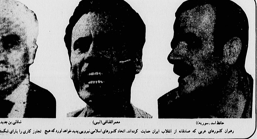
حافظ اسد (سوریه)، معمر القذافی (لیبی)، شاکلی بن جدید (الجزایر)

پس از گلشن نزدیک به سه هفته از جنگ ایران و عراق، و چابداری اکثر کشورهای مترجم و مزدور عربی مانند اردن، مراکش، موریتانی، عربستان، قطر، بحرین و... از رژیم فاشیست و متجاوز بعث عراق، معمر القذافی رهبر بیس از پشتیبانی تلوچی و غیر رسمی الجزایر و سوریه، اولین کشور از جهان عرب بود که قاطعانه و باصراحت تمام حمایت خویش را از جمهوری اسلامی ایران اعلام نمود. هرگاه این اعلام حمایت بی پیامهائی به شاه عربستان و دیگر حکام و شیخ نشینهای خلیج فارس، اظهار نگرانی خویش را از ورود اوگانگامی امریکائی در خلیج فارس اعلام نمود، وی به آنان گوشزد کرد که با این کار یعنی دادن اجازه ورود اوگانگامی به منطقه در حقیقت به سوریه، لبنان و اردو های امریکا بار و متحد همیشگی اسرائیل کمک به سزائی کرده اند. وی همچنین در اردو اوگانگامی به سوریه، عربی را نوبی پذیرش پاهان اسرائیل، ازبائی کرده است. معمر القذافی در نوبی خود خاطرنشان کرده که ما دست دادن استقلال وطن عربی را نپذیریم پذیرد و سپس گفته است: صهیونیسم که روسیه وارد افغانستان شد، امریکا صهیونیسم گرفت نوازده وطن عربی بشود، و افسانه کرده است که «مواقیع می خوریم تا هواپیماهای اخطار عربی امریکائی از شبه جزیره