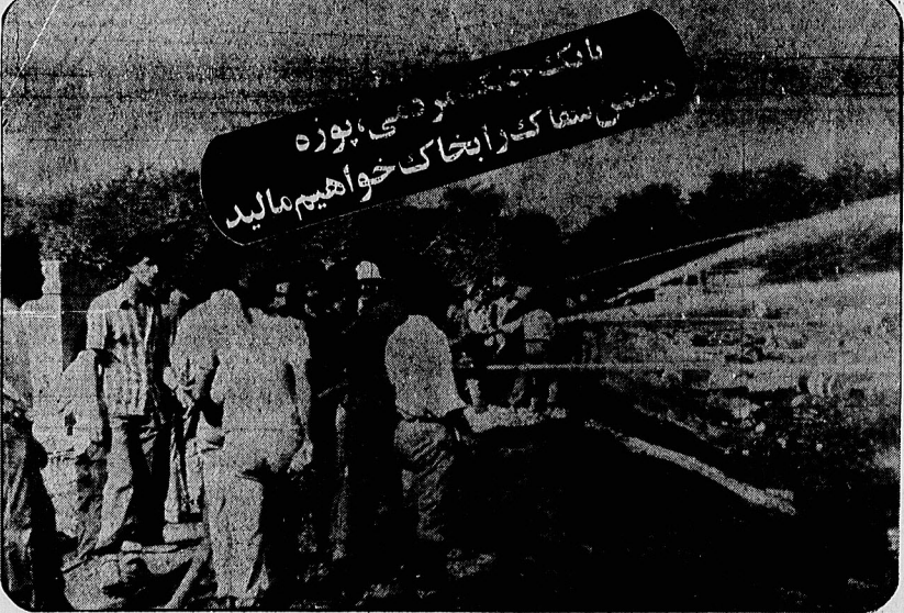
رزمندگان ارتش و پلیس سلیمان و قهرمانان ایران در هم جا در کنار هم مزدوران مهاجم بعثی عراق را دردم می کوبند. کشت های بی دریغ مردم سلیمان اهواز را برای خاموش کردن آتش سوزی ناشی از بمباران مزدوران عراقی نشان می دهد.

جنگنده های نیروی هوایی ایران، متجاوزین عراقی را بشدت کوبیدند در صفحات ۱۱ و ۱۲