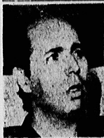
سپهر الجزایر در ایران

مراسم باشکوه یادبود شهدای زلزله الجزایر در تهران برگزار شد در صفحات ۲ و ۱۲