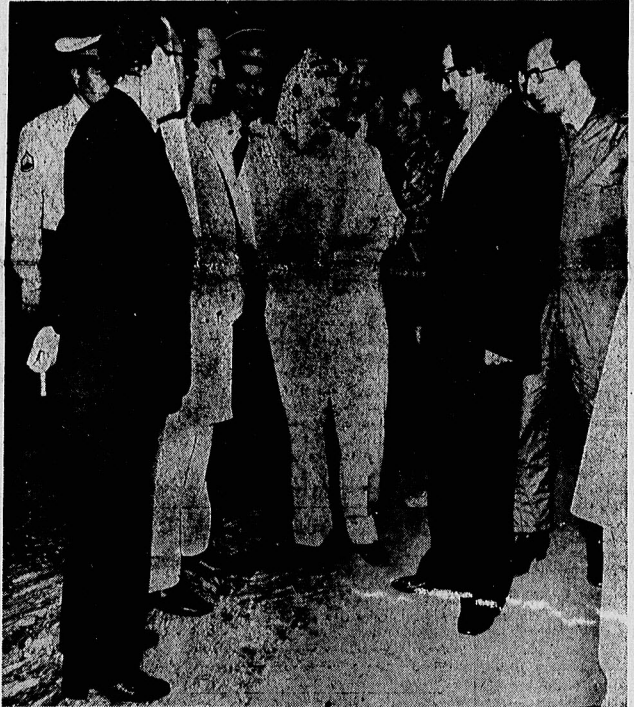
دشمن به دنبال اعلام وضعیت قرمز برای مقابله با حمله هوایی دشمن، و زوال ضیاع الحق رهبر نظامی پاکستان، یاسر عرفات رئیس جبهه آزادیبخش فلسطین و حبیب ثقیلی دبیر کل کنفرانس اسلامی به همراه آقای دکتر بنی صدر رئیس جمهوری به زیر زمین نخستوزیری رفتند.

مزارش سازمان عفو جهانی صدام حسین مخالفان را در زندان مسموم می کند در صفحه ۲ الجزایر و کره شمالی آمادگی خود را برای هرگونه کمک به ایران اعلام کردند در صفحه ۳ کارت سپهیه بنزین برای تاکسی ها و وانت بارها تمهید و توزیع می شود در صفحه ۱۲