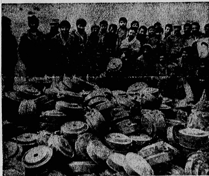
پارتیزانهای سپاه پاسداران دشمن گسترش عملیات تهاجمی خود در داخل خاک عراق نفتی اساسی در خنثی کردن عملیات جنگی ارتش مزدور عراق در جبهه های جنگ دارند و تاکنون صدها مین، ضد تانک و ضد نفر دشمن را کشف و خنثی کرده اند.

سپاه پاسداران ۱۵ سر بازو ۱۰ خودرودشمن را در پادگان «شانه دری» عراق نابود کردند