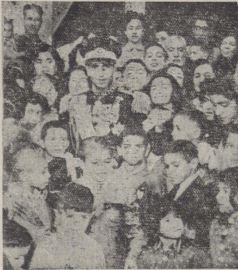
شاهنشاه در میان بازمندگان افسران شبهه نیروی هوایی

در نظر است به بهره‌برداران از معادن کشور کمک مالی شود تا اکنون هشتصد پروانه استخراج و اکتشاف از طرف وزارت اقتصاد صادر شده است برای صادر کنندگان مواد معدنی تسهیلات فوق العادی در نظر گرفته شده از این بعد وصول درآمد معادن بمعهد وزارت اقتصاد ملی خواهد بود چندپ و ژده برای توسعه اکتشاف و استخراج معادن تهیه شده که بزودی موفع اجرا گذاشته میشود از شانزدهم آبان ماه کلیه کالاهای بدون برچسب بشم دولت ضبط میشود