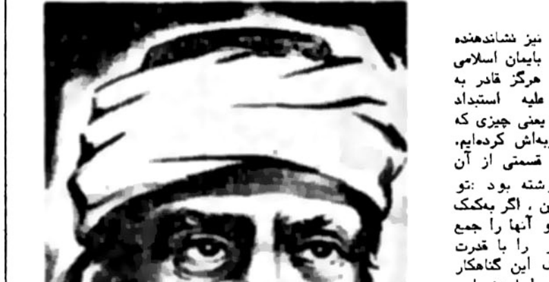
سید جمال‌الدین اسدآبادی

این بود که سرانجام پس از مدت‌ها، درصدم برآمدیم که پاسخی و تحلیلی برای خود را در مورد بیانیه مزبور، در معرض قضاوت تمام خلق و نیروهای مترقی و انقلابی بی‌بگذاریم. تا آنجا که خواستار دانستن نظر خود مجاهدین هستیم، چگونگی دقیق قضایا را از زبان خود ما بشوند، آخسر داشته‌ای که از نزدیک دستی بر آتش داشته‌ایم که از تمامی زیرزمین کارها، آغاز کار سازمان (سال ۱۳۴۴)، مطلقاً در آرزوهای مساجرا مستول و