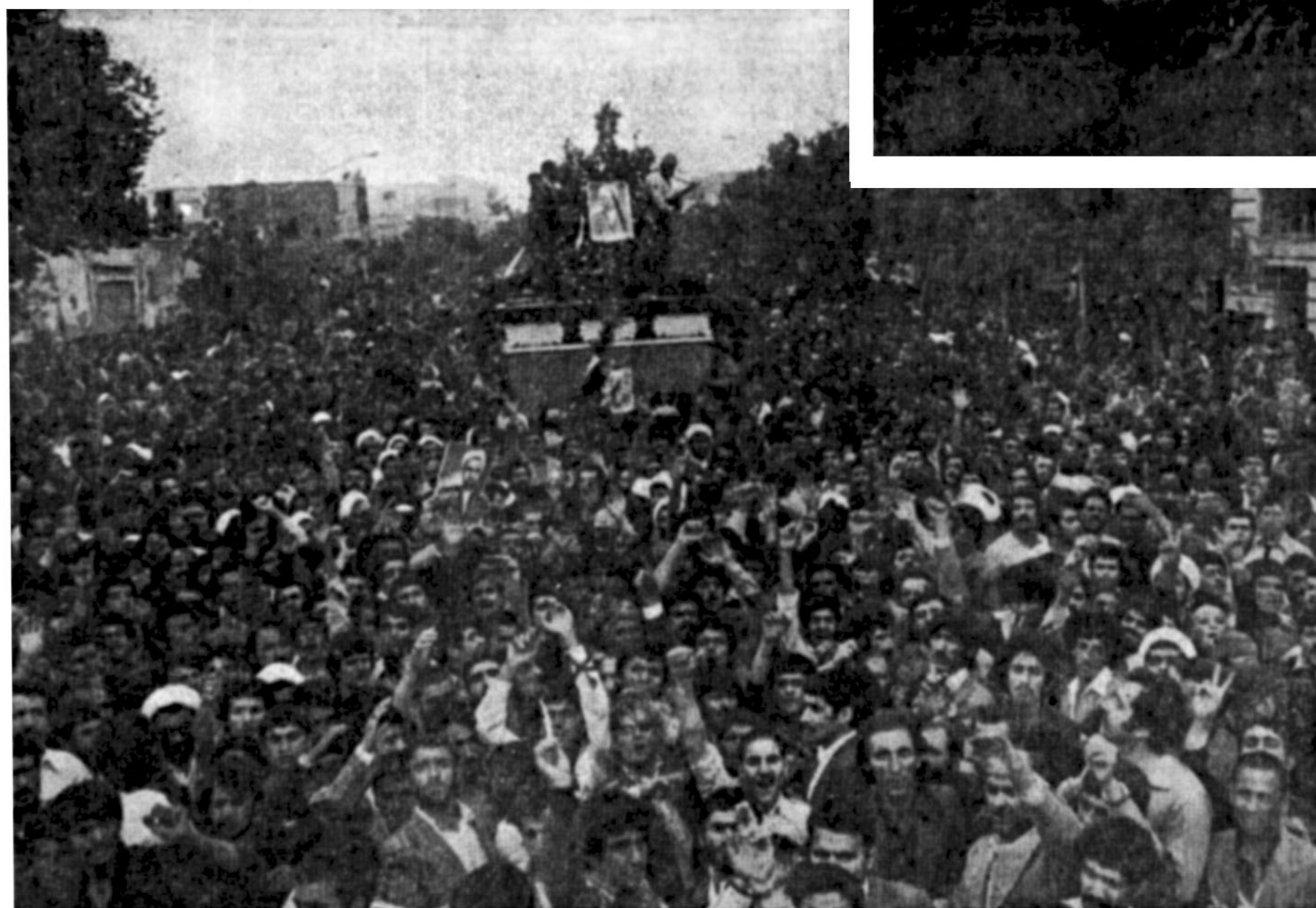
تابوت حامل جنازه متفکر بزرگ اسلامی در میان جمعیتی که نظیر آن تاکنون کمتر دیده شده است

آنها که خود را مسلمان دوازده معرفی میکنند چرا در حکومت سابق آیت‌الله مطهری را ترور نمی‌کردند