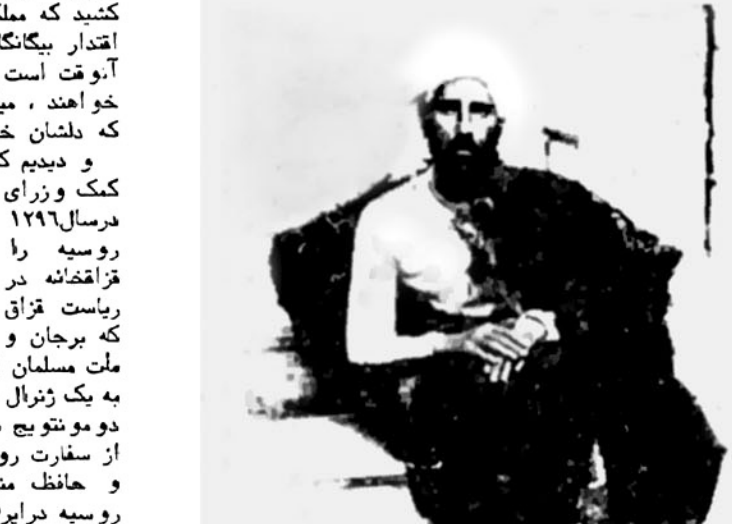
میرزا رضا کرمانی

روز اول ماه مه، بغیر از آنکه یادآور روز بزرگ انقلابی ناصرالدینشاه، بیست مجاهدی که تا امروز، مطبوعات کشور نتوانستند از او چنانکه باید سخن بگویند. سانسور و بختان، در حکومت پلیسی حاکم بر مطبوعات کشور ما، به پنهان کردن، اگر از اعدام انقلابی ناصرالدینشاه سخن می‌آوردند، فکر مشابهت، در ذهن‌ها بیدار میکنند. نزدیک به یک قرن، بویژه ۵۰ سال اخیر، اجازه نداد که مطبوعات، در زمینه این رویداد بزرگ، که بخشی عظیم از تاریخ کشور ما را در برمیگیرد و به تحقیق، مسیر سیاسی - اجتماعی ملت ما را تغییر میدهد، مطلقاً بنویسند، و دیدیم که انتحالی بعد از مرگ ناصرالدینشاه بود که زرمزه مشروطه‌خواهی اوج گرفت و زنجیر استبداد، پاره شد. اگر چه انقلاب مشروطه، به دلایل بسیار که خارج از این بحث است، تغییر جهت داد، استبداد به شکل دیگر، ظاهر گردید. بدین‌سبب است که به انگیزه هتاشودنشاه ناصرالدینشاه، اعدام انقلابی ناصرالدینشاه، این گزارش کوتاه تهیه شده است، که قرار بود، یک روز قبل از روز اول ماه مه چاپ شود، ولی به علت تراکم مطالب و کمبود جادار روزهای گذشته امروز چاپ کرده‌ام.