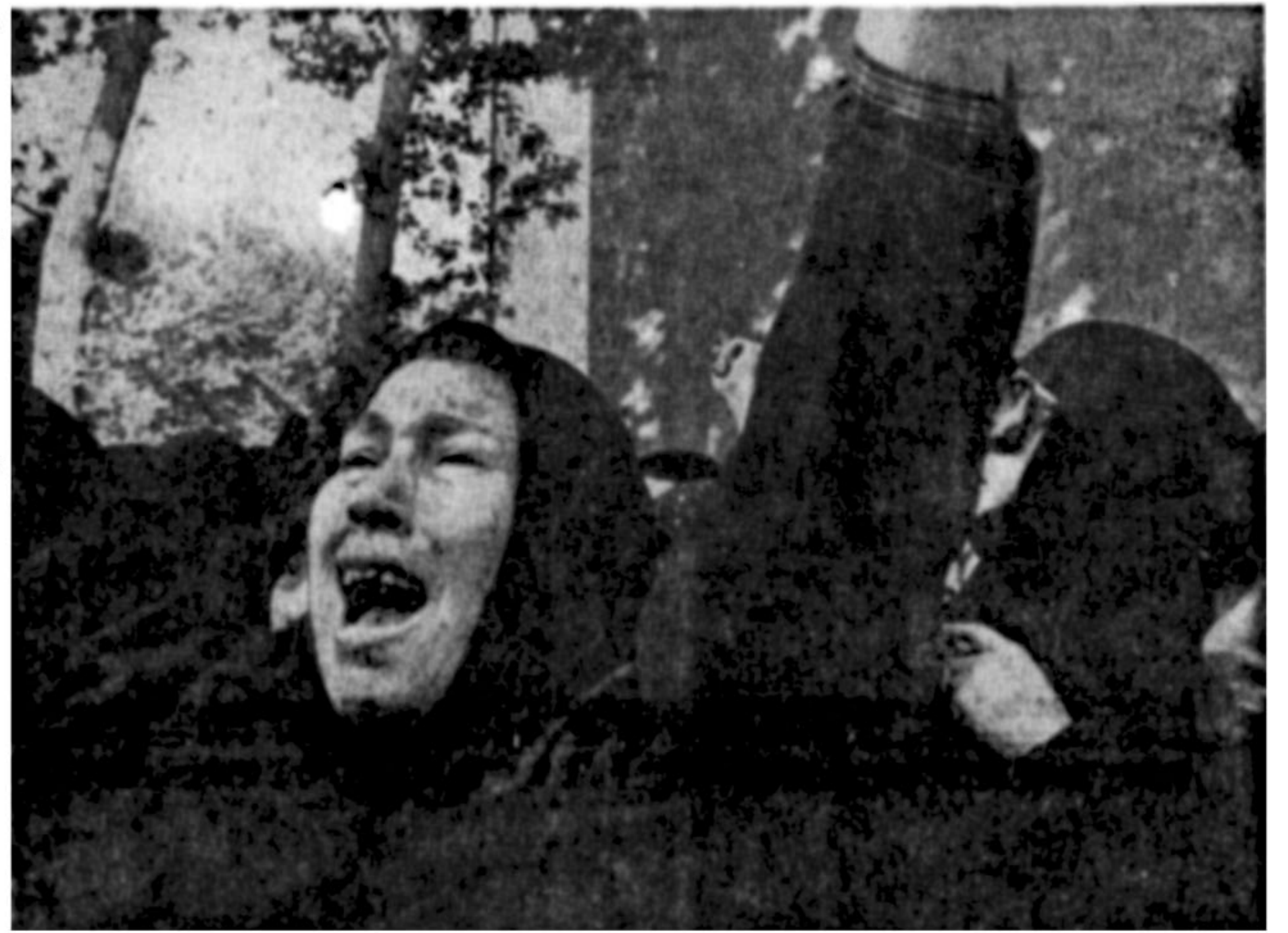
خشم از ترور ناجوانمردانه آیت‌الله مطهری در قیافه این زنان موج می‌زند