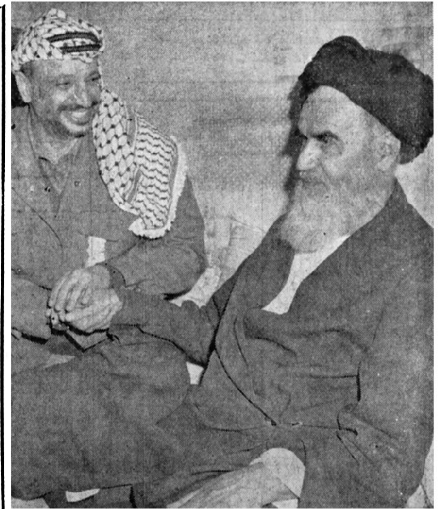
همبستگی انقلاب اسلامی ایران با انقلاب فلسطین، یادگار یاسر عرفات، رهبر سازمان مقاومت فلسطین از ایران، چند روز پس از پیروزی انقلاب، مستحضر شد. پیام امام خمینی به مسلمانان جهان، آغازگر یک حرکت جهانی اسلامی برای آزادی خلق فلسطین است