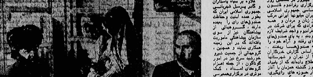
حکایت از مسئولان

تعمیر کارتر از جزیره نبات ● ستار: تعمیر کارتر از جزیره نبات، موضوعی است که در این مقاله به آن پرداخته می‌شود.