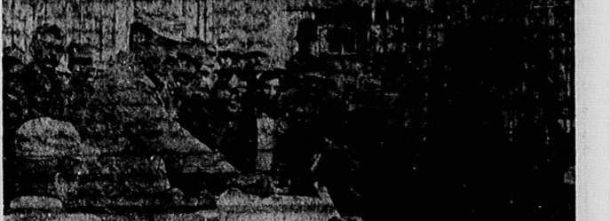
پشت درهای بسته واشنگتن

من در تاریخ جهان نظیر آنچه را که حتی انقلاب فرانسه را ... ● ستار: من در تاریخ جهان نظیر آنچه را که حتی انقلاب فرانسه را ندیده‌ام. این واقعه بسیار مهم است.