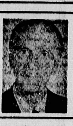
دکتر شمس‌الدین امیرعلایی سفر جمهوری اسلامی ایران - پاریس

تعمیر کارتر از جزیره نبات ... ● ستار: چنانچه جزایر امیرعلایی در استان تهران واقع شده است و در زمان شاه پهلوی در جزایر مازندران واقع شده است. این جزایر در استان مازندران واقع شده است. این جزایر در استان مازندران واقع شده است. این جزایر در استان مازندران واقع شده است.