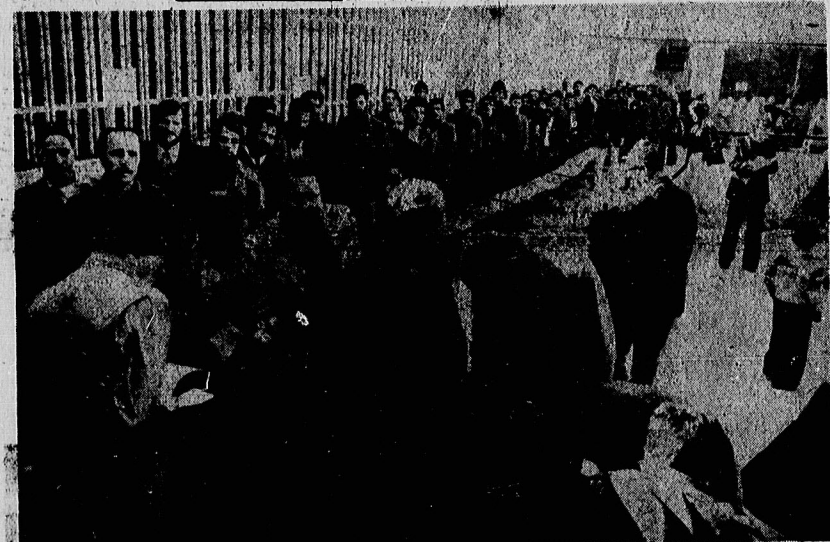
نیروز و امروز جلوی های ایرانی ، به پای صندوق های رای رفتند و برای سر نوشت سال خود را در صندوق ها انداختند. محسن از یکی حوزه اخذ آراء در تهران پروا نداشت

شرکت دخانیات ایران در اعلامیه اعلام کرد برای تعیین مصرف داخلی سیگار ضمن تلاش برای افزایش بیشتر قیمت تولیدات داخلی نزدیک انواع سیگار های جدید به بازار می آید در اعلامیه شرکت دخانیات با اشاره به این نکته که کشور های آمریکایی طرف ده سال اخیر ، این شرکت را به یک شرکت جاسوسی سیگار های خارجی تولید کرده اند ، اعلام کرد در سال ۱۳۴۸ ، حدود ۵ میلیون سیگار و دخان وارد کشور شد و این رقم