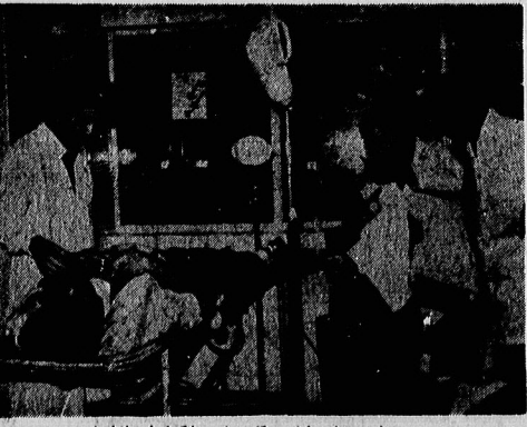
✳️ در دوران حادثه بیگان بر خورد تا کمپسف تا شاهان بر مرزها محاصره شدند