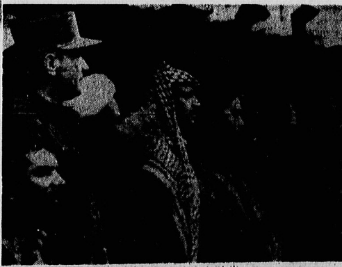
✳️ بنی صدر، نخست الاسلام احمد خمینی، باسرفرمانت و بلندایگان ارتش جمهوری اسلامی، از رژه نیرو حسان می بینند.

اعتراض جبهه ملی به قانون انتخابات مجلس ✳️ قانون انتخابات مجلس شورای ملی قانون اساسی جمهوری اسلامی را نقض کرده است در صفحه ۱۲