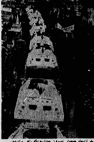
✳️ از تمام جمعیت دیروز چندان بونکه راهی برای عبور زبونتها و تانک ها نمانده بود، و همین وضع سبب بروز حادثه خونین شد.

۱۱ نفر تاکنون کشته شده اند خط آهن جنوب در چند منطقه زیر آب رفت در صفحات ۲ و ۳ شورای سرپرستی رادیو تلویزیون کنار نمیرود ✳️ از اتای خونینی ها باید خواسته شود که به کار خود ادامه دهند ✳️ استعفاء دادن وزیر به معنای پذیرفته شدن استعفاء نیست ✳️ هیچگونه تصمیم تازه ای برای تغییر وزرا گرفته نشده است در صفحه ۲