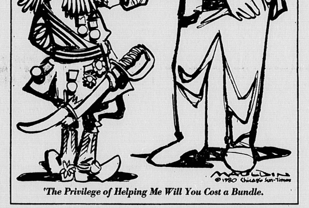
'The Privilege of Helping Me Will You Cost a Bundle.'