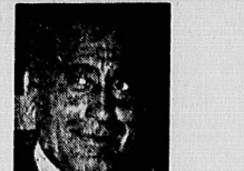
از محمد حسین هیکل روزنامه‌نگار برجسته عربی

کارتز ، که موصول هیجان انگیز قدرت «تصورسازی» آمریکاست ممکن است قربانی هیجان انگیز آن هم بشود!