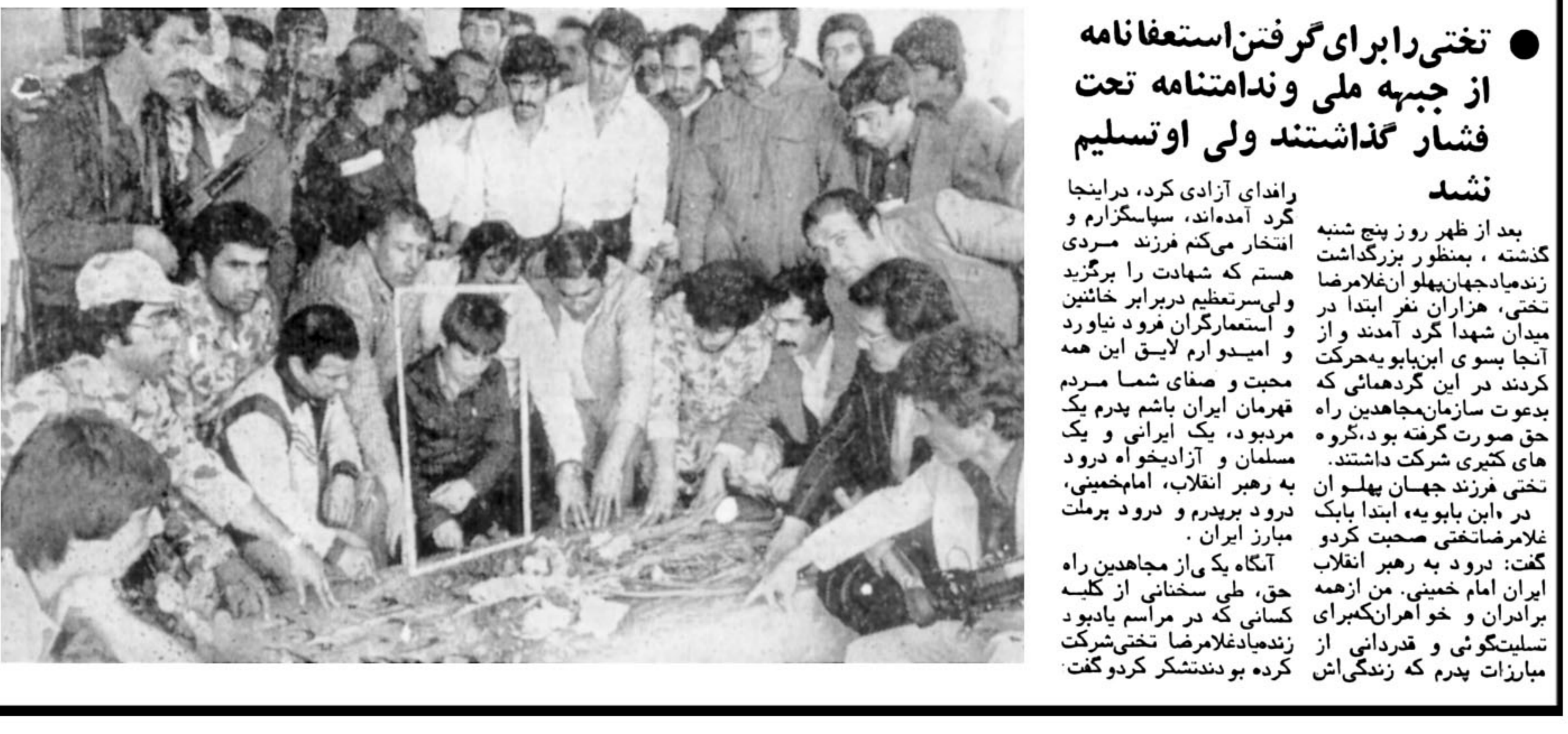
در مراسم تجلیل باشکوه و بزرگداشت جهان پهلوان غلامرضا تختی گفته شد

تختی را برای گرفتن استعفا نامه از جبهه ملی و ندامتنامه تحت فشار گذاشتند ولی او تسلیم نشد راندای آزادی کرد، در اینجا کرد آمده اند، سیاستگزارم و انتخار می کنم فرزند سردی هستم که شهادت را برگزیدم و لهی سر تنظیم در برابر خائنین و استعمارگران فرود نیارود و استعدارم لایق این همه محبت و صفای شما مردم قهرمان ایران باشم پدرم یک حق صورت گرفته بود، گروه مسلمان و آزادیخواه درود های کثیری شرکت داشتند. تختی فرزند جهان پهلوان در این بابویه ابتدا بابک غلامرضا تختی صحبت کرد و گفت: درود به رهبر انقلاب ایران امام خمینی، من از همه برادران و خواهران کبرای زنده یاد غلامرضا تختی شرکت تسلیتگویی و قدردانی از مبارزات پدرم که زندگی اش