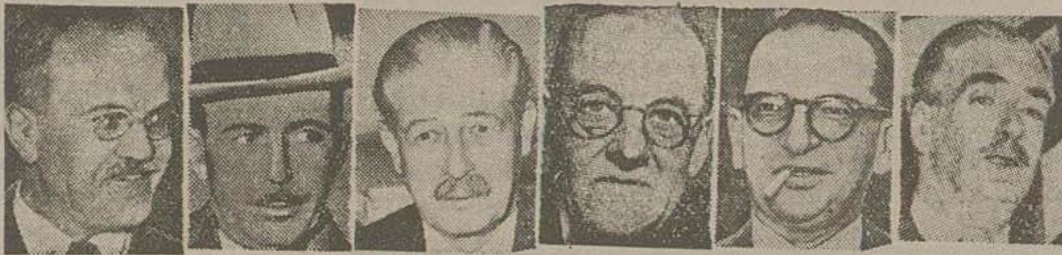
آیدن، نور، دالس، مک میلان، بینة، مولوتف

مولوتف هنگام ورود بژنو در حالیکه میخندید از مصاحبه با مخبرین خودداری کرد