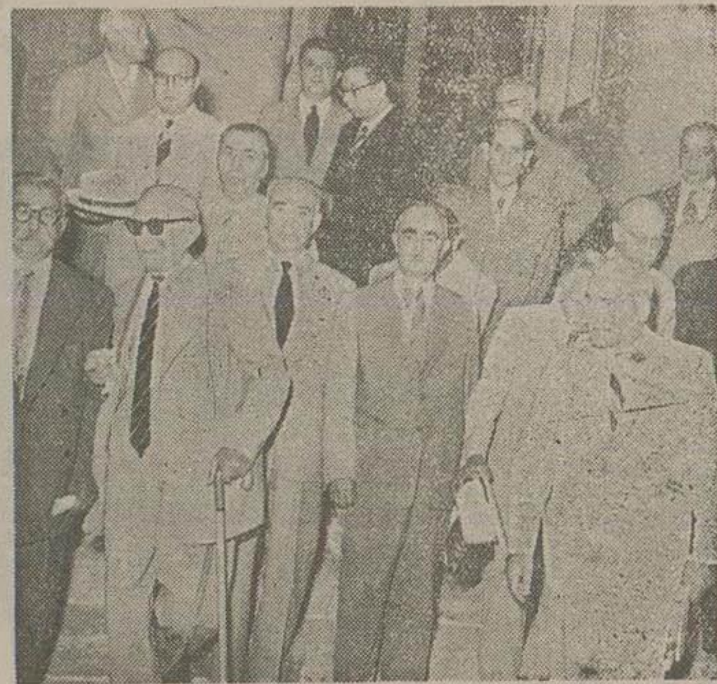
شرح در صفحه دوازدهم

انتشار نام اعضای هیئت نمایندگی اتحاد جماهیر شوروی در کنفرانس ژنو در محافل سیاسی بین المللی بعنوان عامل جدیدی در کنفرانس تلقی شده است. بطوریکه در آخرین خبرهای جهان در روز پنجشنبه در اخبار خارجی دیروزه با اطلاع خوانندگان رساندیم مارشال ژوکوف وزیر دفاع شوروی و نیکیتا خروشوف دبیر اول حزب کمونیست شوروی جزو هیئت نمایندگی شوروی برنو خواهند رفت. ریاست هیئت مزبور با مارشال بولگاکین خواهد بود. اعضای دیگر هیئت نمایندگی شوروی عبارتند از مولوتف وزیر امور خارجه و کرومیکو. علاوه بر این پنج نماینده، پنج مشاور نیز عضویت هیئت نمایندگی بقیه در صفحه نهم