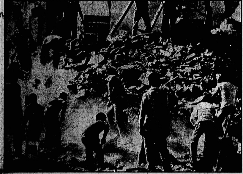
بزرگیان بشی که خود را مسلمان می‌دانند باموشک های ۹ متری شهرها و مناطق مسکونی ما را ویران میکنند.

۳۰ بوناب چهار موشک ۹ متری زمین به زمین به مناطق مسکونی اهواز و دزفول ۹ نفر کشته و ۴۳ نفر مجروح شدند.