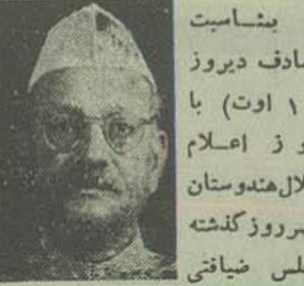
بشناسبت تصادف دیروز (۱۵ اوت) با روز اعلام استقلال هندوستان همسر روز گذشته مجلس ضیافتی