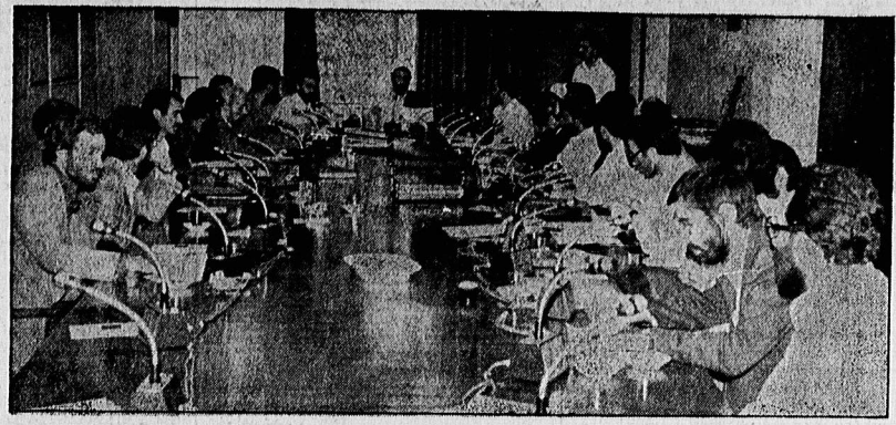
جلسه هیات دولت، دیروز ریاست دکتر باهر نخست وزیر تشکیل شد. مسایل مهم داخل و خارج کشور مورد بررسی و بحث قرار گرفت. در صفحه ۴

جزئیات حمله جنگنده های امریکایی به لیبی در صفحه ۲۰ ربایندگان ناوچه ایرانی تحت حفاظت پلیس فرانسه قرار گرفتند * فرانسه، ناوچه‌برده شده ایران را پس می‌دهد در صفحه ۲۰