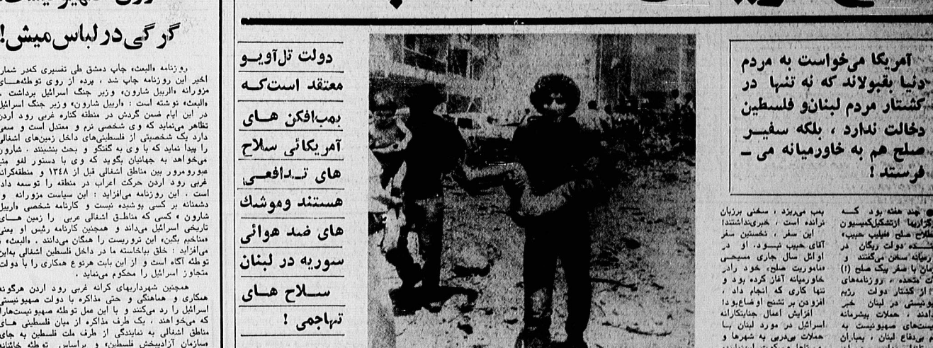
اردوگاه زندانی، پس از حمله بریهایی یگن، ایستاد بیست سفر صلح فرستاده‌گان.

جنگ خنده دو کسده... صلیب سفید... کشتار مردم لبنان و فلسطین... صلح هم به خاورمیانه می فرستد!