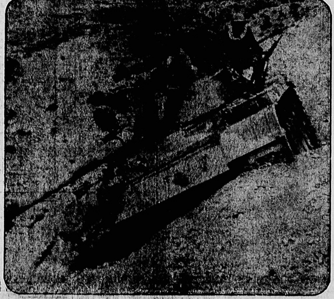
۲ میگ عراقی در کامیاران سرنگون شد

هوانیروز مواضع دشمن در جبهه آبادان را منهدم کرد