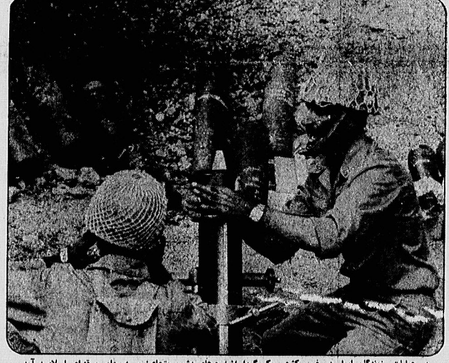
در عملیات رزمندگان ایران در غرب کشور یک گردان از نیروهای دشمن متجاوز به محاصره قوای اسلام درآمد. عکس گوشه‌ای از عملیات رزمندگان دلاور ایرانی راهگام هدفگیری مواضع دشمنی بوسیله خمپاره انداز نشان می‌دهد.

کزارش اعضای حزب کارگران اطلاعات به جبهه‌های جنگ یک گردان زرهی دشمن در «سر پل ذهاب» متلاشی شد