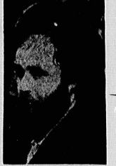
برادر حجت الاسلام سید احمد خمینی