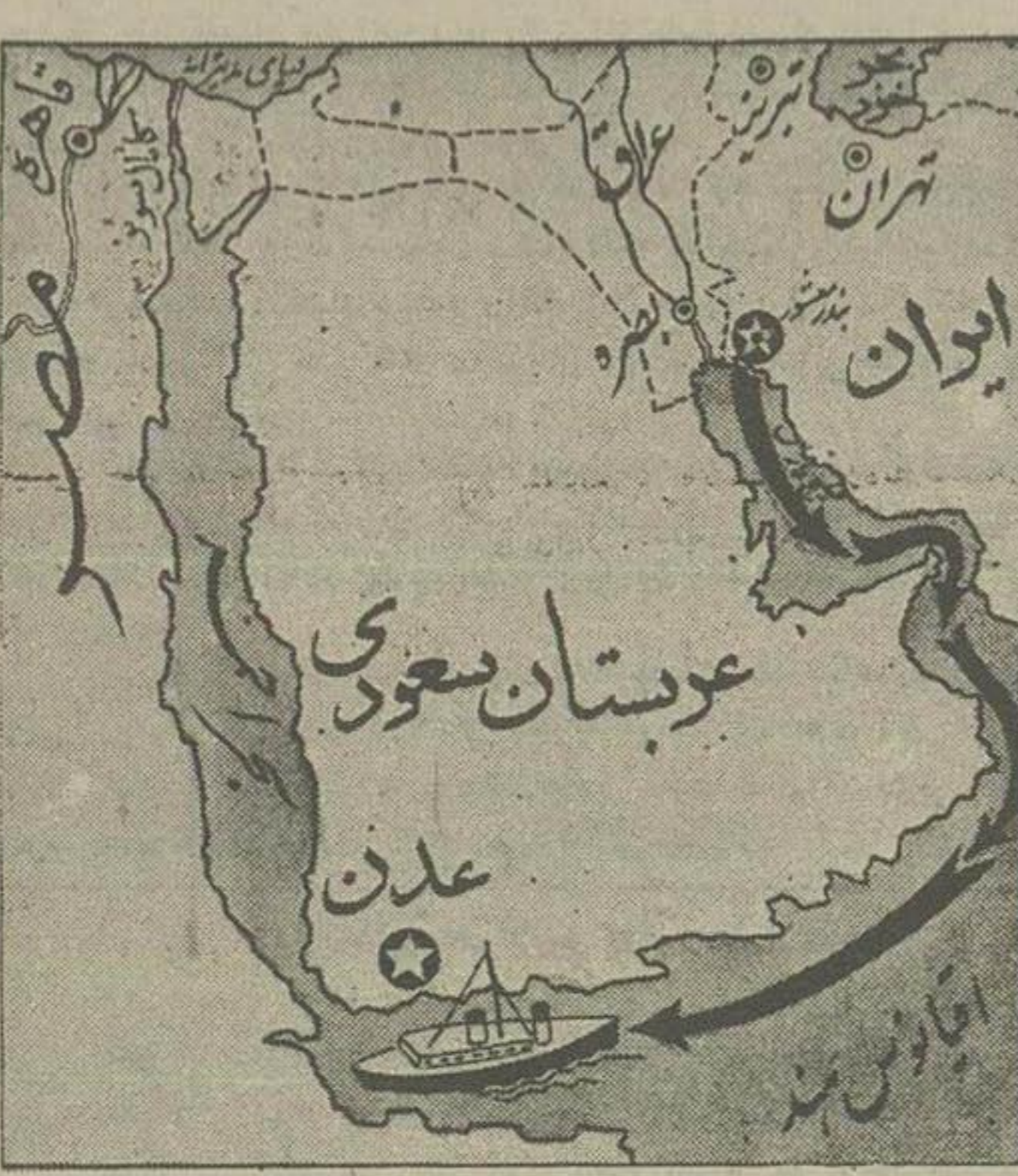
اطلاعاتی درباره بندر عدن

پریش، بعد از آنکه کشتی نفتکش کوچک «روزماری» حامل نفت ایران وارد بندر عدن شد، یک هواپیمای بر فراز آن پرواز کرد و مأمور مسلحی بر روی اسکله اش قرار دادند تا خدای نفتکش اطلاع داد که از عواقب عملش بی خبر بوده است ناخدای کشتی میگوید: من احتیاجی نداشتم که در عدن لنگر بیندازم ولی دستور دادند امروز ناخدای کشتی در دادگاه از خود دفاع نموده و خواهد گفت که ما دامیکه دادگاه لاهه رای خود را صادر نکرده است حرکت این کشتی بلامانع خواهد بود - هنگام ورود کشتی به بندر عدن غوغائی برپا شد پرواز یک هواپیمای مرموز بر فراز روزماری - اختلاف شرکت ایتالیائی با صاحبان نفتکش