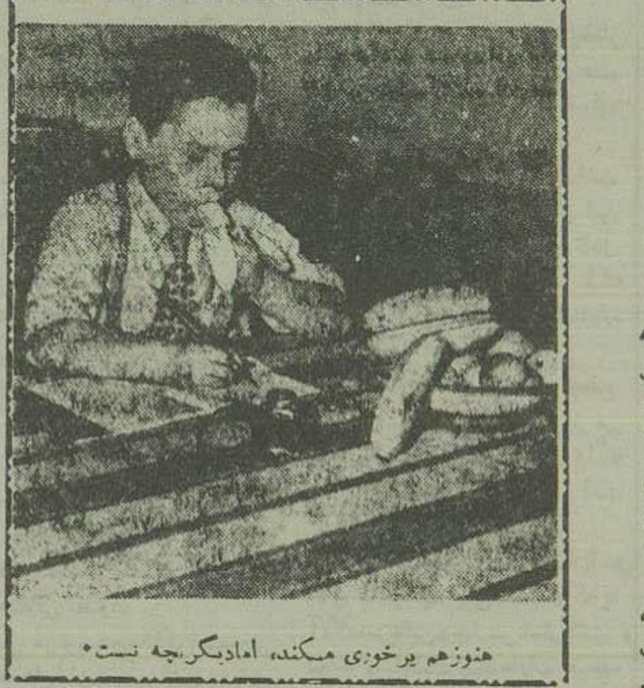
هنوز هم بیخبری میکند، اما دیگر بچه نیست *

دختران عزیز: برائت فضاها می متعدد شده کدبانو، تصمیم گرفتیم هر هفته دوروز باشا کتک کوی خصوصی داشته باشد. اما اگر آغاز سخن با مالاست دیال کردن آن باشا است. ما امروز قدم برداشته ایم برای اینکه بیش از پیش بهر دلها ی دختران جوان گوش دهیم و ناآشنا که از دست ما برآید در چه و چه خبری زندگیشان کنیم. این کار سترگی است و برای اینکه در این رهگذر فتح و پیروزی با ما قریب باشد لازم است که شما خود در این کار ما با یاری دهید، اما همکاری کنید، اخبار محیط کار خود را، آنچه را که در دستانتان، بیمارستان و یا در کلاس شما میکند ناما در میان نهد و مطمئن باشید که ما آقدر حوصله داریم که همه درد دلها ی شما را بشنویم. ستون دختران ما، متعلق همه دختران جوان ديار ما است و همین سانس زمین بیکرانی است. دختران ما، گروه بزرگی هستند، آنها مادران نسل آینده ما هستند، آنها خود دارند و باید نقش بزرگی در زندگی اجتماع ما بازی کنند. کدبانو با کمال میل حاضر است فعالیت دختران جوان را در هر رشته از مظاهر زندگی که روزنامه منعکس نماید کدبانو چشم بر آن نامه های شماست.