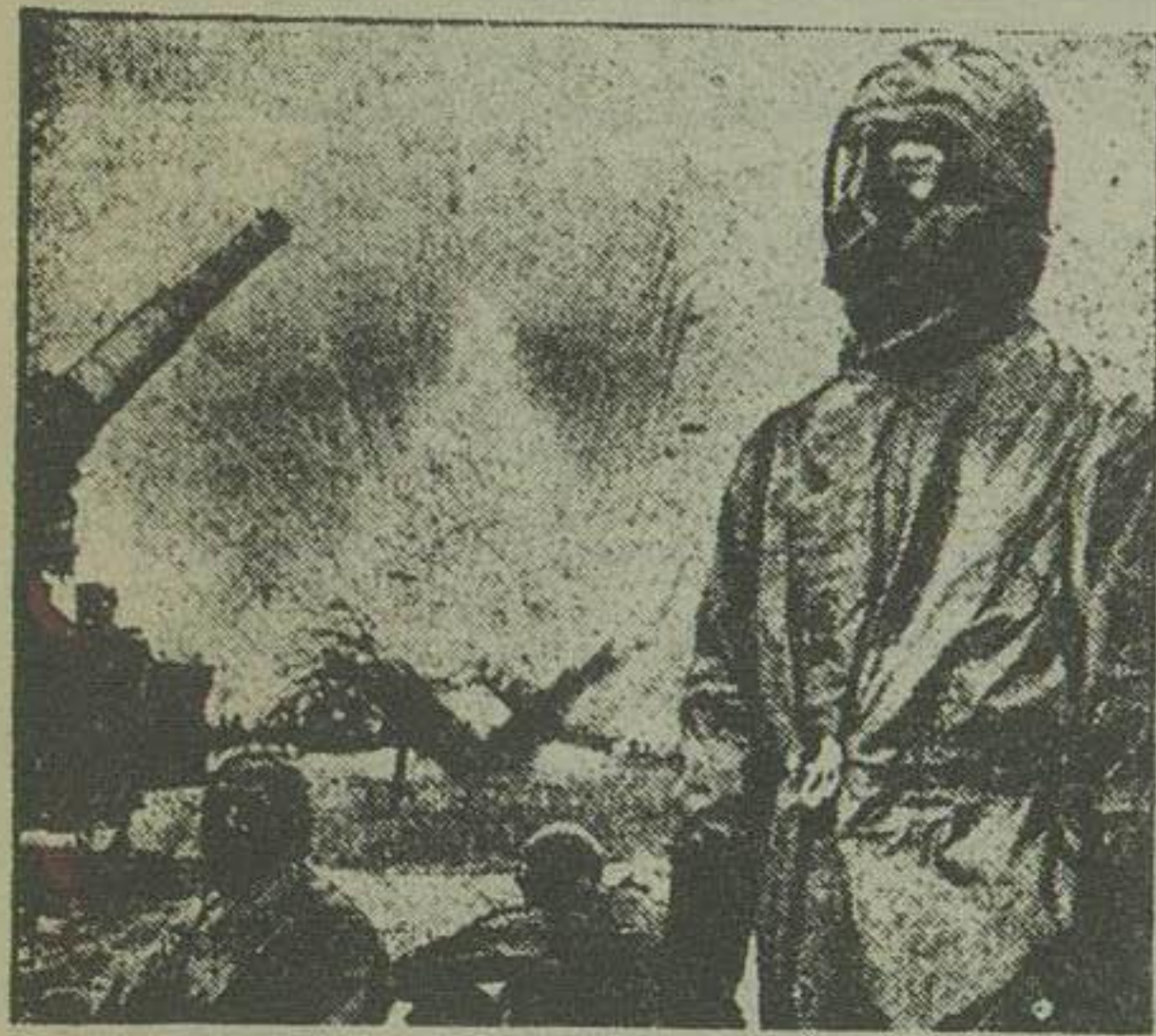
یک قسمت از واحدهای توپهای آبی که لباس‌های مخصوص مجهز هستند

این توپهای بسیار دور و بردی اشکال با گلوله‌های آبی بمباران می‌کنند