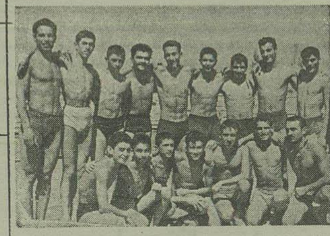
شناکران باشگاه تاج که مقام اول قهرمانی تهران را بدست آوردند

مسابقات توشیقی شنا و شیرجه و واترپولی باشگاههای تهران در نظر فدراسون شای کشور از روز شنبه در استخر شماره یک امجدیه با حضور عده کثیری از علاقمندان انجام گردید. مسابقات نهائی نیز صبح روز جمعه (دیروز) انجام یافت و در نتیجه در قسمت شنا تاج مقام اول شد و قهرمان باشگاههای تهران معرفی گردید و باشگاههای سپه و نیکماف رفت شریب دوم، سوم، چهارم شدند.