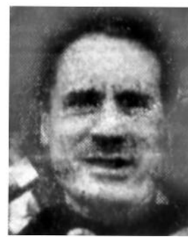
سر هرنک قذافی رئیس جمهوری لیبی

● لیبی درخواست تشکیل کمیته مشترکی را برای تحقیق پیرامون ناپدید شدن امام موسی صدر کرد