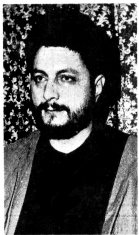
امام موسی صدر رهبر شیعیان لبنان

اتومبیلهای شخصی نمی توانند در محدوده مرکزی تهران حرکت کنند و باید در پادگانهای نظامی اطراف پارک نمایند ☆ طرح حل مشکل ترافیک از دو هفته دیگر اجرا میشود در صفحه ۲