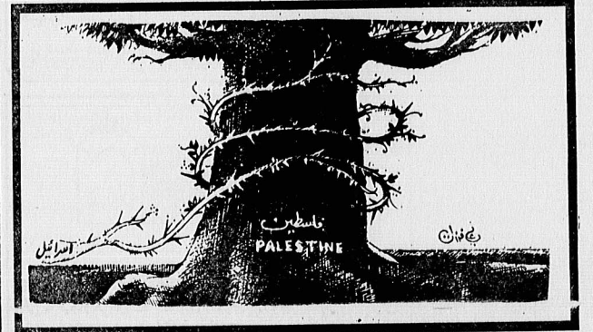
طرح از اشیرات عربی

حفاظت آمریکاییها ایالات متحده خاور میانه را بعنوان بخشی از منطقه تحت نفوذ خود می‌داند (و می‌داند). آمریکا باقی‌مانده حق سوبلینت برزگرایی در نفوذ شوروی و خاور میانه دارد. اما شوروی از آیمان اعراب حمایت کرده، کمک‌های مالی و تکنولوژیکی به آنها کرده برتری از همه اعراب را مسلح کرده. در سال ۱۹۷۳ آمریکا با اسرائیل همکاری کرده و در آن شوروی روسیه و اسرائیل همکاری داشته تا اسلحه شوروی ممکن کند. از آن پس که سادات بفرار آمریکا رفته است، آمریکا باقی‌مانده جای پای هر چه بیشتری را در جهان عرب پیدا کرده و پایگاه‌های زیادی در مصر، سومالی و سومیر (که قبلاً انگلیس از آن استفاده می‌کرد) به دست آورده‌اند. علاوه بر این، آمریکا از تسبیلازی در سودان، عمان، بحرین، عربستان سعودی و مصر نیز می‌کند. یکی از کامیابیهای شاخص آمریکا اینست که پس گرفتن سنیاء از اسرائیلیها در ژوئن سال ۱۹۸۱ بوده است. از پایگاههای اسرائیلی در سنیاء توسط آمریکا کشته می‌شود نظارت بر منطقه استفاده می‌شود و آمریکا از این پایگاهها همچنین برای مداخله نیروی واکنش سریع که منظور حفاظت منافع استعمارگرانه غرب از منابع نفتی و نیز برای