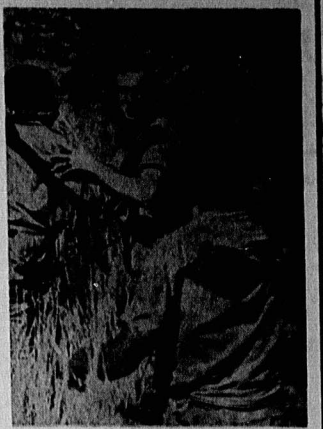
سرباز مزدور پرتغال سالار در اسارت انقلابیون آنگولا؛ دستگیر شده‌ها در برقراری ... اما امروز آمریکایی‌ها چنان دست بردار نیستند.