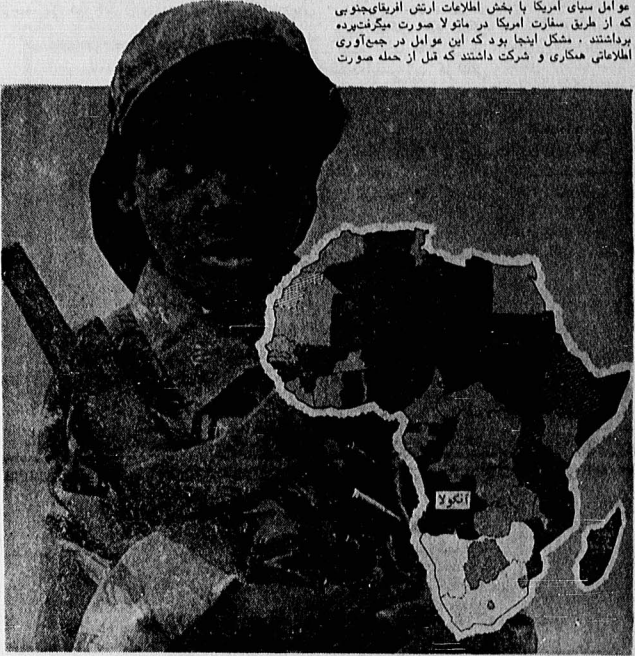
آفریقایاخبار... آنگولا بار دیگر در معرض تجاوزات وحشیانه آفریقای جنوبی است، اما سرسختانه از انقلاب و استقلال خود دفاع می‌کند.

مداخله در امور داخلی آنگولا، آشکار و نهان، منتهی می‌شود. در میان، این اصلاحیه، جریان هرگونه تک‌تالی به چنین پروژه‌هایی را نیز بطور اخص متوقف می‌سازد. با جنگ و پیمان در فاصله کنی‌پورت، هنگامی باسیست رده‌روشی برگان-هنگ، دولت خواهان این است که بدون کوچکترین مانع در سر راه خود رسماً بتواند مداخله در امور داخلی آنگولا را مجدداً آغاز نماید. نکته اساسی لایحه مذکور، این است که صرفاً در مورد آنگولا قابل اجراست، از اینرو هرگونه تلاش برای ابطال و یا نسخ آن، ضرورتاً پیمان‌آهن است که گام سفید قصد دارد آنگولا را بطور اخص مورد توجه قرار دهد. نکته طنزآمیز و درمیانجی، تفسیر آن است که ما از هم‌اکنون می‌توانیم چگونگی و علت از هم‌پاشی یکسای همکاری سیای آمریکا با آفریقای جنوبی (دوست و متحد همکار) به توصیف بکنیم. چرا حمله آفریقای جنوبی به ماتولا درسی حمله ژانویه گذشته آفریقای جنوبی به ماتولا، در موزامبیک، نیروهای امنیتی موزامبیک از همکاری کلارک، متحد شد که مداخلات تجاوزگرانه خود در آنگولا پایان دهد. آمریکا این تهدید را پذیرفت، اما همکاری از سانسالی حکومت آنگولا خودداری ورزید و اخیراً اظهارات ریگان مبنی بر قطع یا ابطال لایحه اصلاحیه کلارک، به‌منابه آغاز جنگ اعلام شده علیه آنگولاست که شانه‌های آن به صورت تهاجم رژیم مزدور آفریقای جنوبی به آنگولا نمایان شده است.