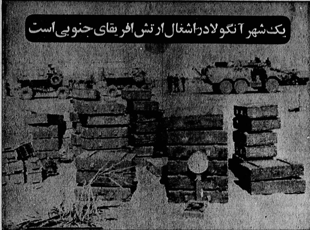
یک شهر آنگولا در اشغال ارتش افریقای جنوبی است

نیروهای اشغالگر و مزدور افریقای جنوبی، با اشغال بخشی از آنگولا، با تخریب زیربنای دربار و تخریب چریک‌های سوازی هستند. انزو مهمات نیروهای اشغالگر، در عکس دیده می‌شود که برای کشتار آزادخواهان آنگولا بکار برده می‌شود.