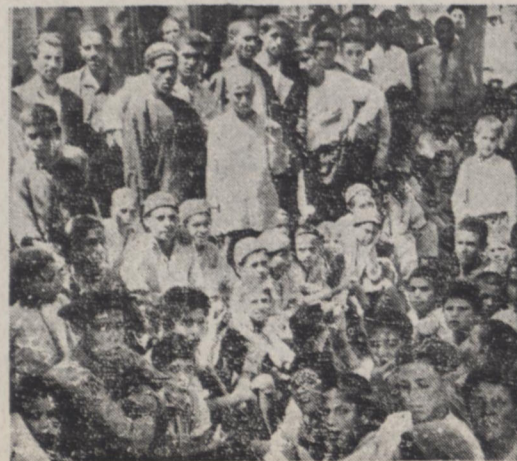
عدهای از کارگران کوره پزخانه‌ها هنگام تجمع در برابر وزارت کار

صاحبان کارخانه‌ها با پرداخت صدی با نژده اضافه حقوق و اوقت کرده‌اند