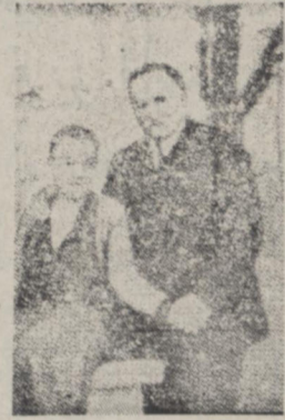
هاوس هوفر با تاق هس در خوش

ژنرال آرنل هاوز، هوفر که مربی و مشاور هیتلر بود و هس را بانگلستان فرستاد علت این مسافرت را بیان می کند پشوی آلمان هر روز دوسه بار بوسیله تلفن با این ژنرال فیلسوف صحبت می کرد و هفته ای یکبار نزد او میرفت