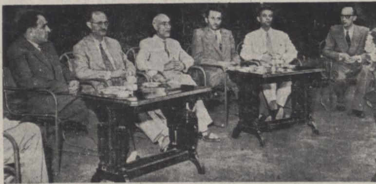
چندتن از آقایان وزیران در جلسه ملاقات دیروز عصر خود با رئیس جدید مجلس در باغ بهارستان