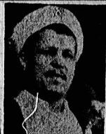
آیتالله موسوی اردبیلی وهاشمی رفسنجانی، امیرالمؤمنین شورای موقت ریاست جمهوری