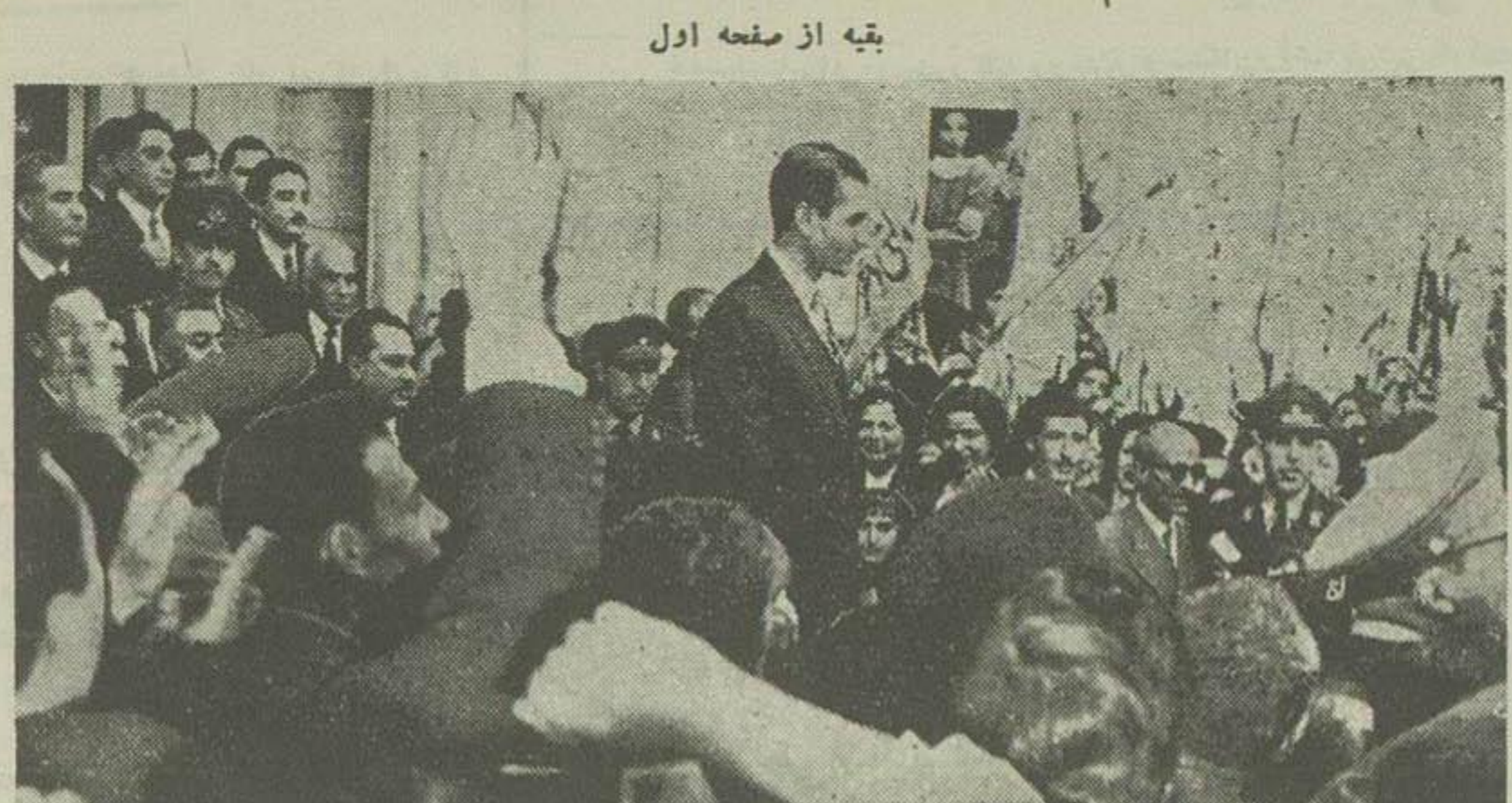
در عکس بالا شاهنشاه در میان ابراز احساسات جوانان پیش آهنگ و ورزشکاران که در محوطه کاخ مرمر اجتمع نموده بودند دیده میشوند