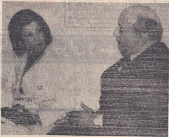
مجمع عمومی سازمان ملل متحد از جلسه روز شنبه گذشته در ژنوا خبر داد که این سازمان در مورد بحران خاورمیانه به بحث پرداخته است. مجمع عمومی سازمان ملل متحد در روز شنبه گذشته در ژنوا خبر داد که این سازمان در مورد بحران خاورمیانه به بحث پرداخته است.