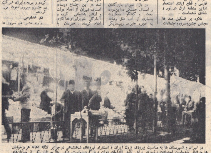
تهران باشادی از جزایر باز یافته صحبت میکند

طبقات مختلف تهران اعمال حاکمیت ایران را جشن گرفتند