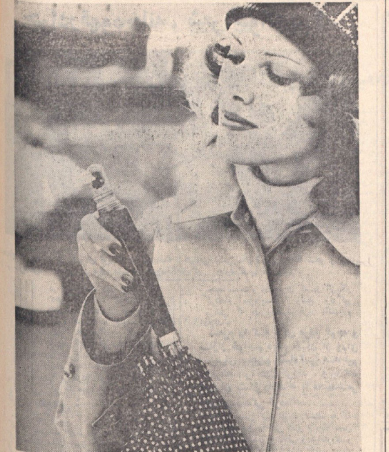
خانمها گاز اشک آور بکار میبرند! بمناسبت فرا رسیدن «گرمس» (عید میلاد مسیح) از جمله خانها این تکمه گاز اشک آور خارج می شود. حال کدام فرد است که بتواند متعری خانمها را از این جرحا داند بشود؟!