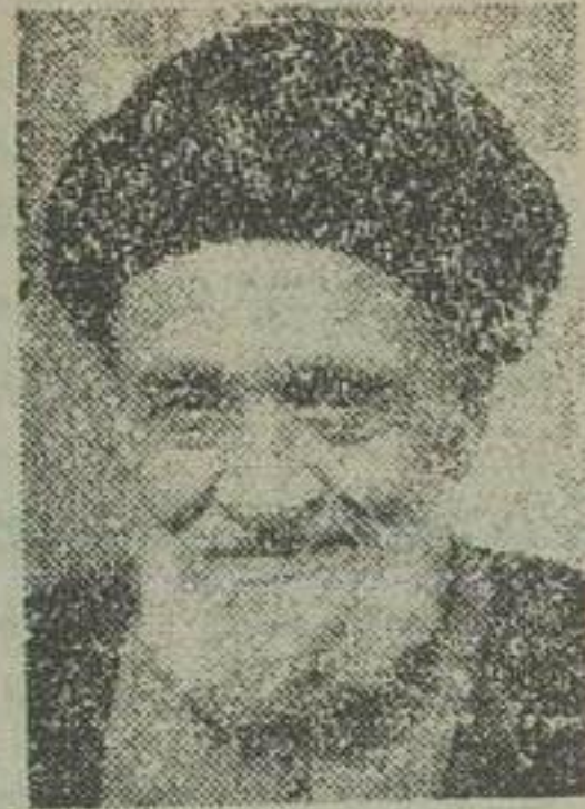
حضرت آیت الله کاشانی

معرفی معاون وزارت دادگستری ساعت دویتم صبح امروز آقای لطیفی وزیر دادگستری در کاخ سفید آمد آباد پیشگاه اعلیحضرت همایونی شرفیاب شد و آقای دکتر ملک اسمعیلی را به معاونت وزارت دادگستری پیشگاه ملوکانه معرفی نمود.