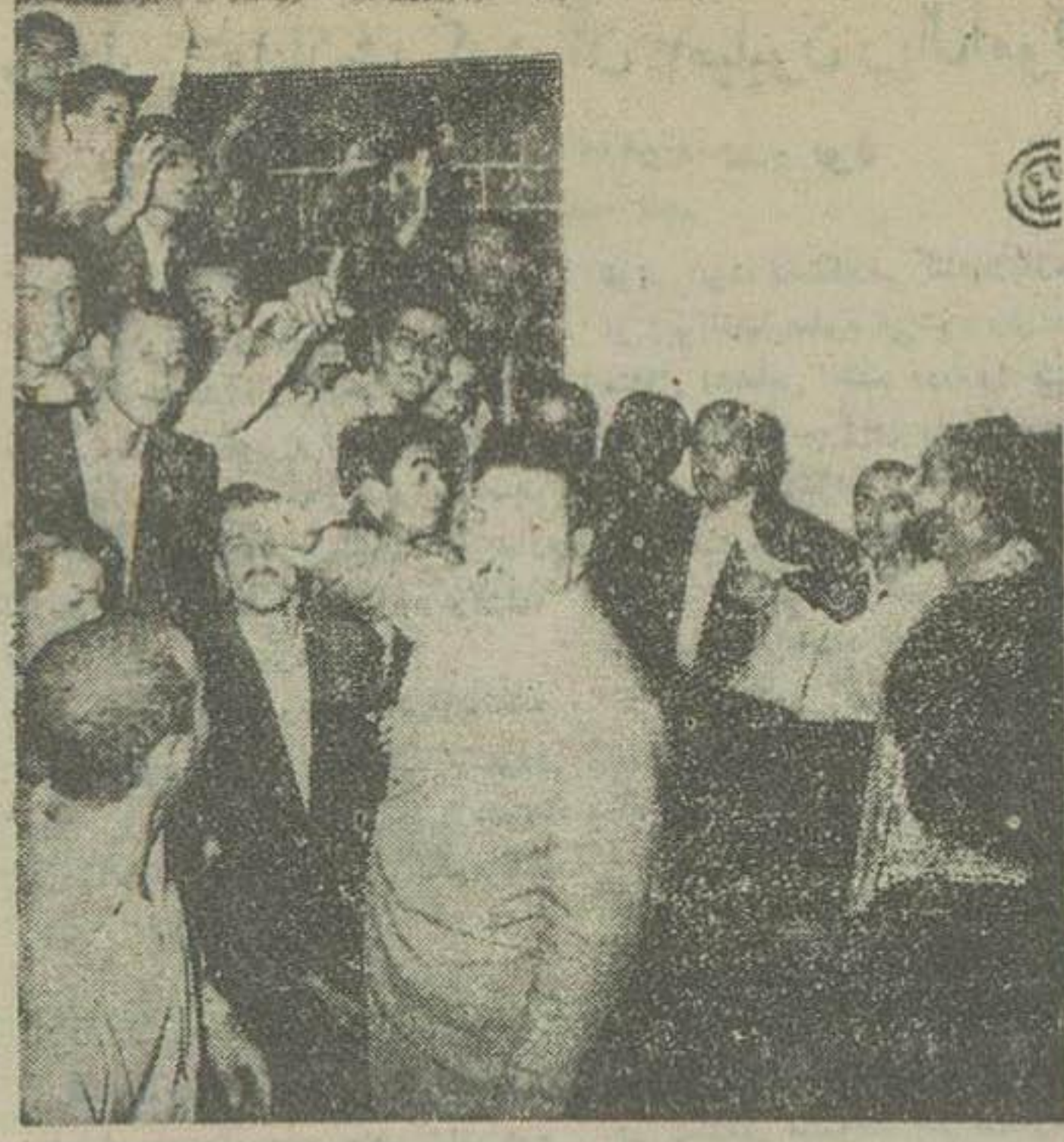
نزدیک بود تظاهر کنندگان بدخل تالار جلسه هجوم نمایند آقای قنات آزادی نیز آنها را دعوت بحفظ نظم ننمودند

معاون وزارت کار آقای شاپور بختیار بست معاون وزارت کار انتخاب شده و امروز در وزارتخانه حضور یافت و مشغول کار گردید.