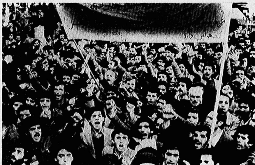
دیروز فرهنگیان شهر ری، خشمگین از توطئه‌ها و ترورهای جدید ضد انقلاب، سازنده اصلی ضد انقلاب، امپریالیسم امریکارامحکوم کردند.

خشم مردم نسبت به امپریالیسم امریکا بی پایان است: مرگ بر امپریالیسم دشمن مستضعفان