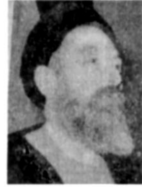
آیت الله دکتر بهشتی

در مورد اینگونه برخورد های خصمانه نمونه های زیادی را می توان برشمرد که واقعه در ناک روز سه شنبه مقابل دادگستری که به شصت شدن چهار نفر انجام میدادند کل انقلاب را بر آن داشت تا به همه گروه ها و دستجات سیاسی هشدار دهد که ادامه چنین وضعی خطرناک است