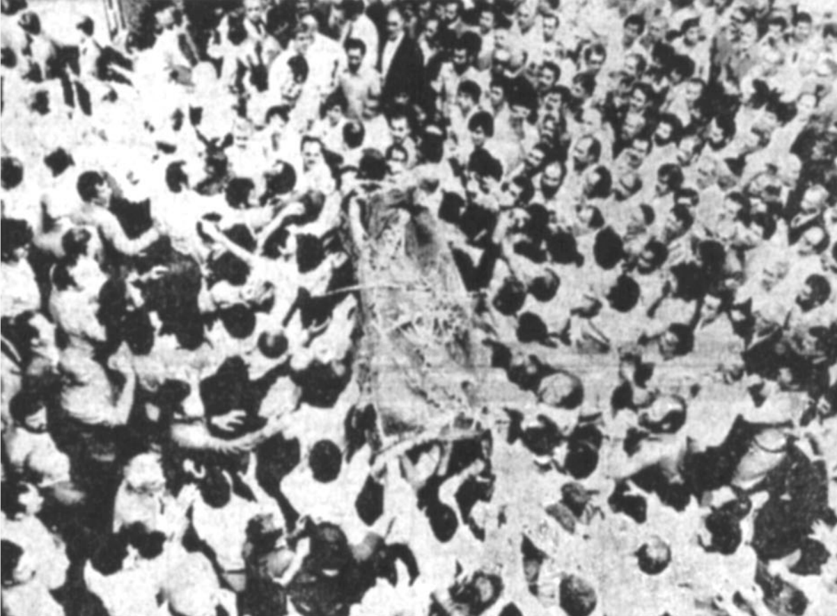
عکسی از تشییع جنازه مرحوم طرخانی که امروز صبح در تهران برگزار شد