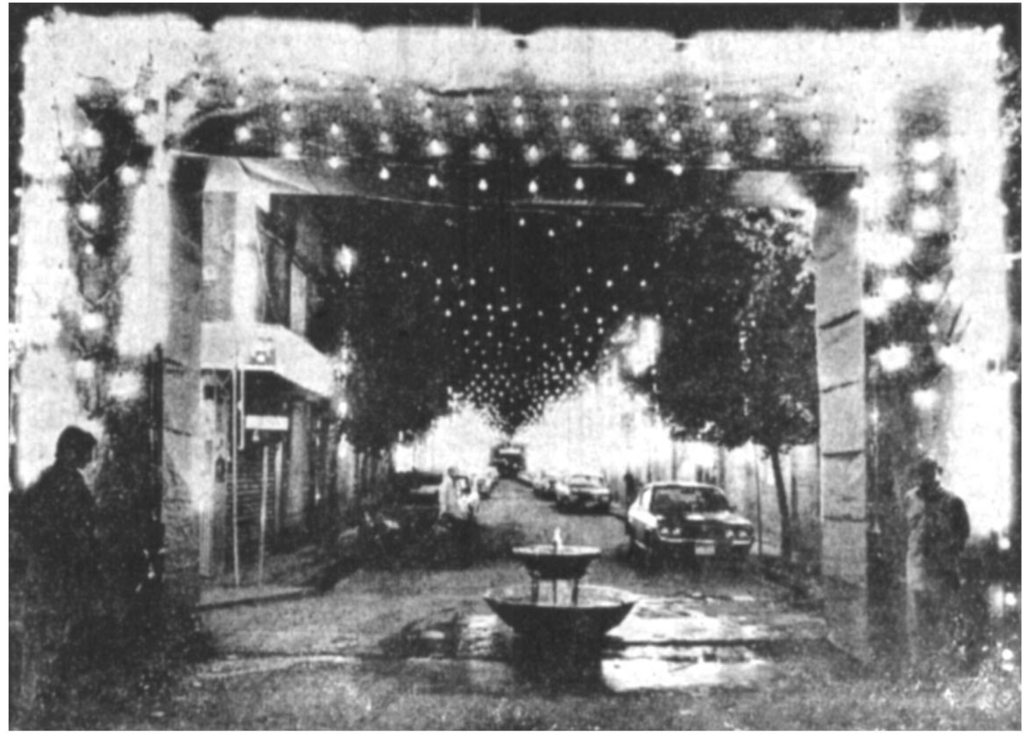
در شهرهای ایران هزاران طاق نصرت به مناسبت ولادت با سعادت مهدی موعود (ع) بسته شده ، و شبها شهرهای ایران غرق نور است