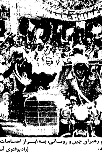
هوا کوئونگ و هیئت همراهی او در استقبال در رومانی. هوا کوئونگ و هیئت همراهی او در استقبال در رومانی.

بیروت - یونایتد پرس - سازمان آزادیبخش فلسطینی دیروز در بیانیه‌ای اعلام کرد که سازمان سیا و سرویس‌های امنیتی اسرائیل با مسوولان انفجار عظیمی در بیروت اعلام کرد که در هفته گذشته نزدیک به ۲۰۰ نفر را به کشتن داد. بر اثر این انفجار یک ساختمان مسکونی در بیروت، که محل ادارات یک گروه تندرو فلسطینی بود با خاک یکسان شد. تاکنون هیچ گروهی مسوولیت این انفجار را به عهده نگرفته است. سازمان آزادیبخش فلسطینی اعلام داشت که ترافیک مسوولیت در بیانیه‌ای اعلام کرد که سازمان سیا و سرویس‌های امنیتی اسرائیل با مسوولان انفجار عظیمی در بیروت اعلام کرد که در هفته گذشته نزدیک به ۲۰۰ نفر را به کشتن داد. بر اثر این انفجار یک ساختمان مسکونی در بیروت، که محل ادارات یک گروه تندرو فلسطینی بود با خاک یکسان شد. تاکنون هیچ گروهی مسوولیت این انفجار را به عهده نگرفته است. سازمان آزادیبخش فلسطینی اعلام داشت که ترافیک مسوولیت در بیانیه‌ای اعلام کرد که سازمان سیا و سرویس‌های امنیتی اسرائیل با مسوولان انفجار عظیمی در بیروت اعلام کرد که در هفته گذشته نزدیک به ۲۰۰ نفر را به کشتن داد.