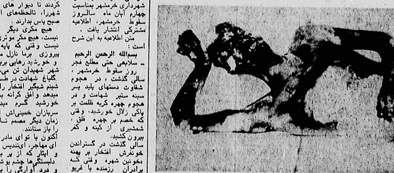
نگ و طرب و نغمه‌های باغ، ای کوه‌های باق که جسم بجران بلدان خدای را پس از بخت رساندن آتش میزاید بدان امید (واهر) کلاه خراب و طوبت خلق و خدای، چندی خلایق میبودند که از شوق و به آتش کشیدند و جود خیرخواه بدست شما، چیزی جز نگر و نگرانی و زبونانیت و زبونانیت پیش از آنهم بدن مجید ما (شریف و اقیان) را مغانسه منجر کردید و سوزانید و راجه جانی فریید.

بسمه تعالی اطلاعیه قابل توجه فروشندگان لوازم خانگی در تهران و شهرستانها